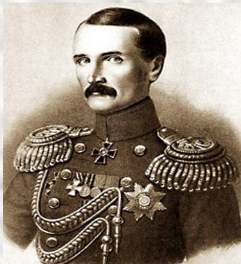
Корнилов Владимир Алексеевич (13 февраля 1806 года — 17(5) октября 1854 года).