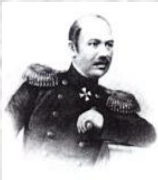
Истомин Владимир Иванович (6(18).03.1809 г. — 7(19).03.1855 г.).