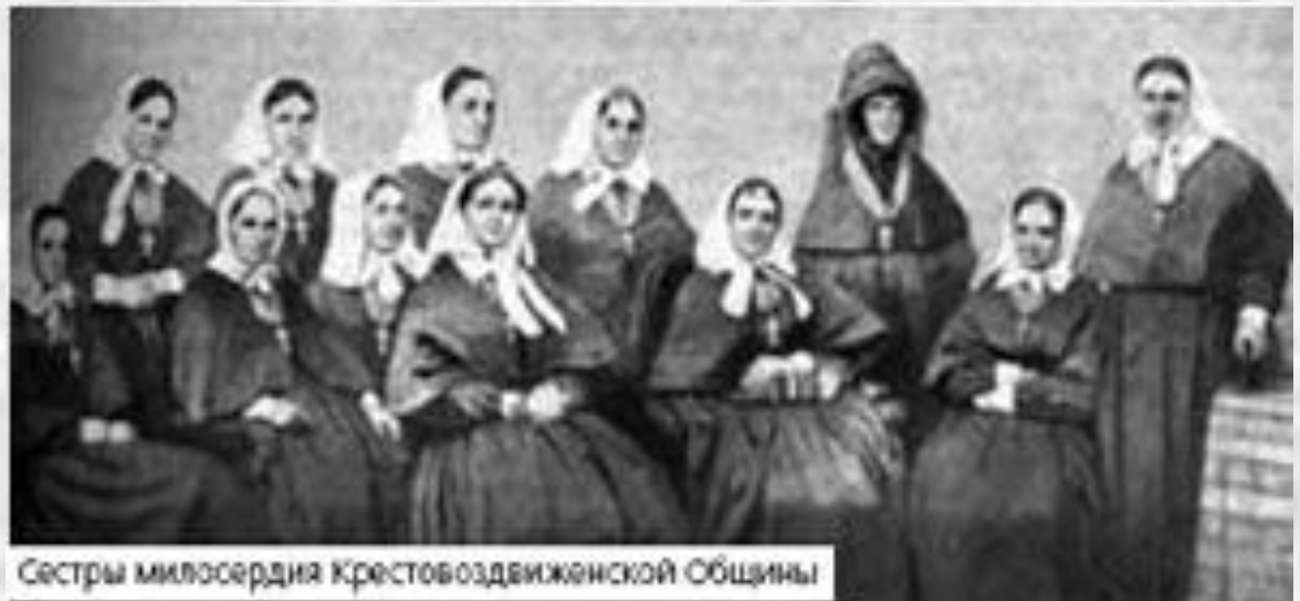
Сестры милосердия Крестовоздвиженской Общины