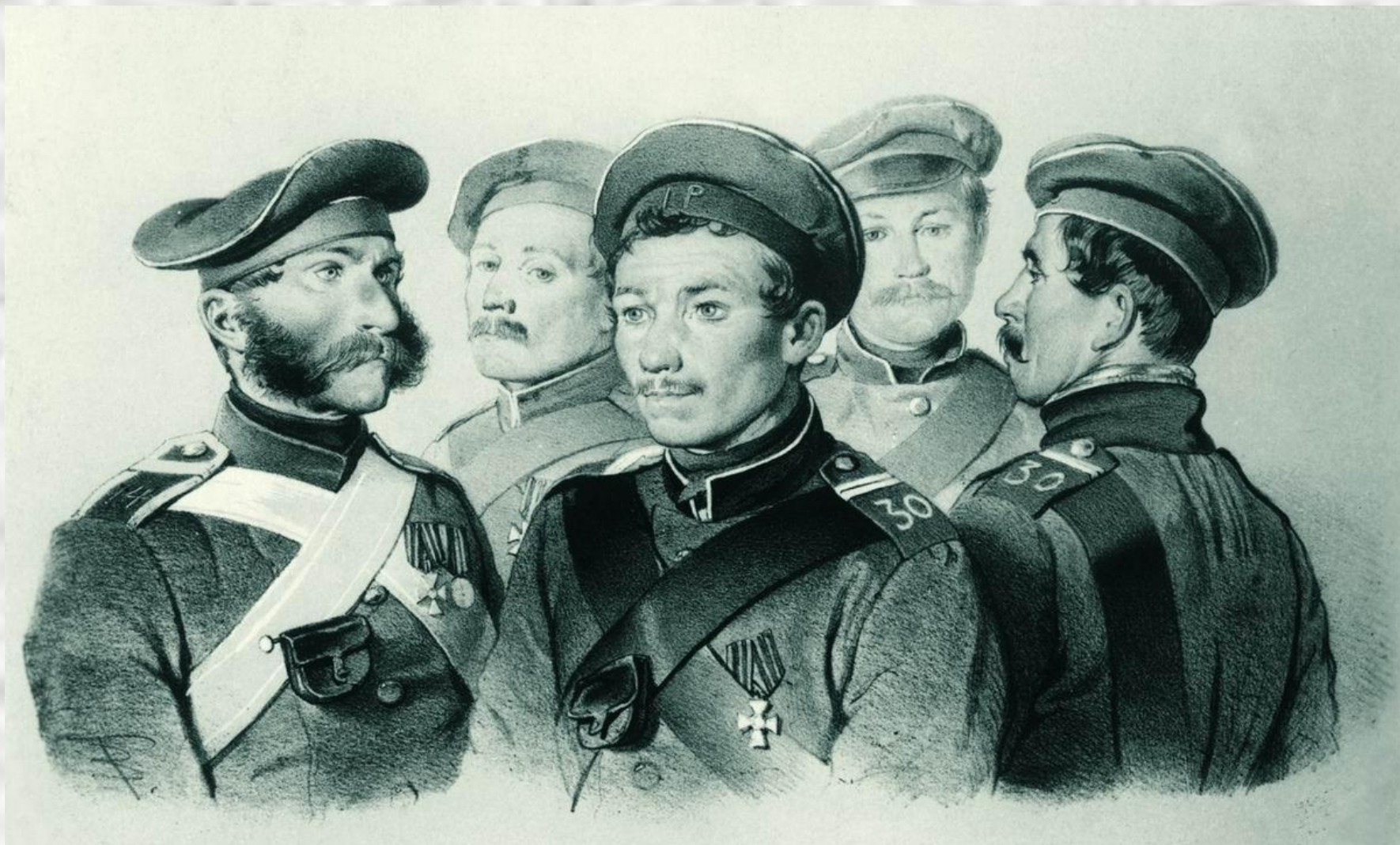
В.Ф. Тимм «Участники обороны»