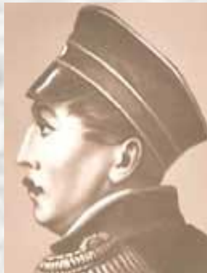
Павел Степанович Нахимов (23 июня (05.07)1802 - 30 июня (12.07) 1855)