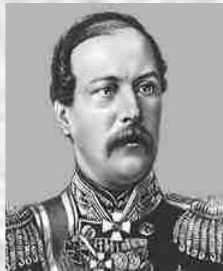
Тотлебен Эдуард Иванович (8(20).5.1818, — 19.6(1.7).1884).