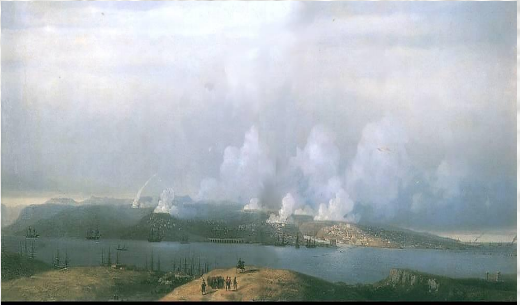
И.К. Айвазовский «Осада Севастополя»