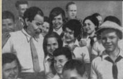
М. Горький о писателях — авторами книги «Вам курьезно». Фотография.