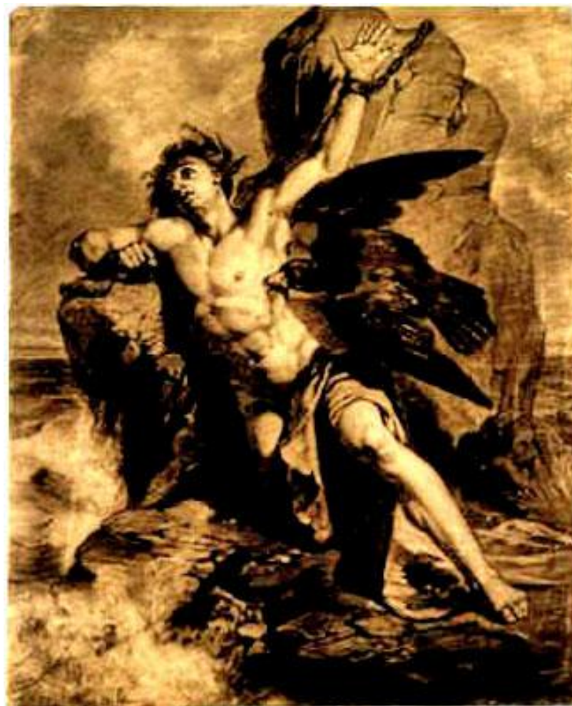
Автор неизвестен Прометей прикованный