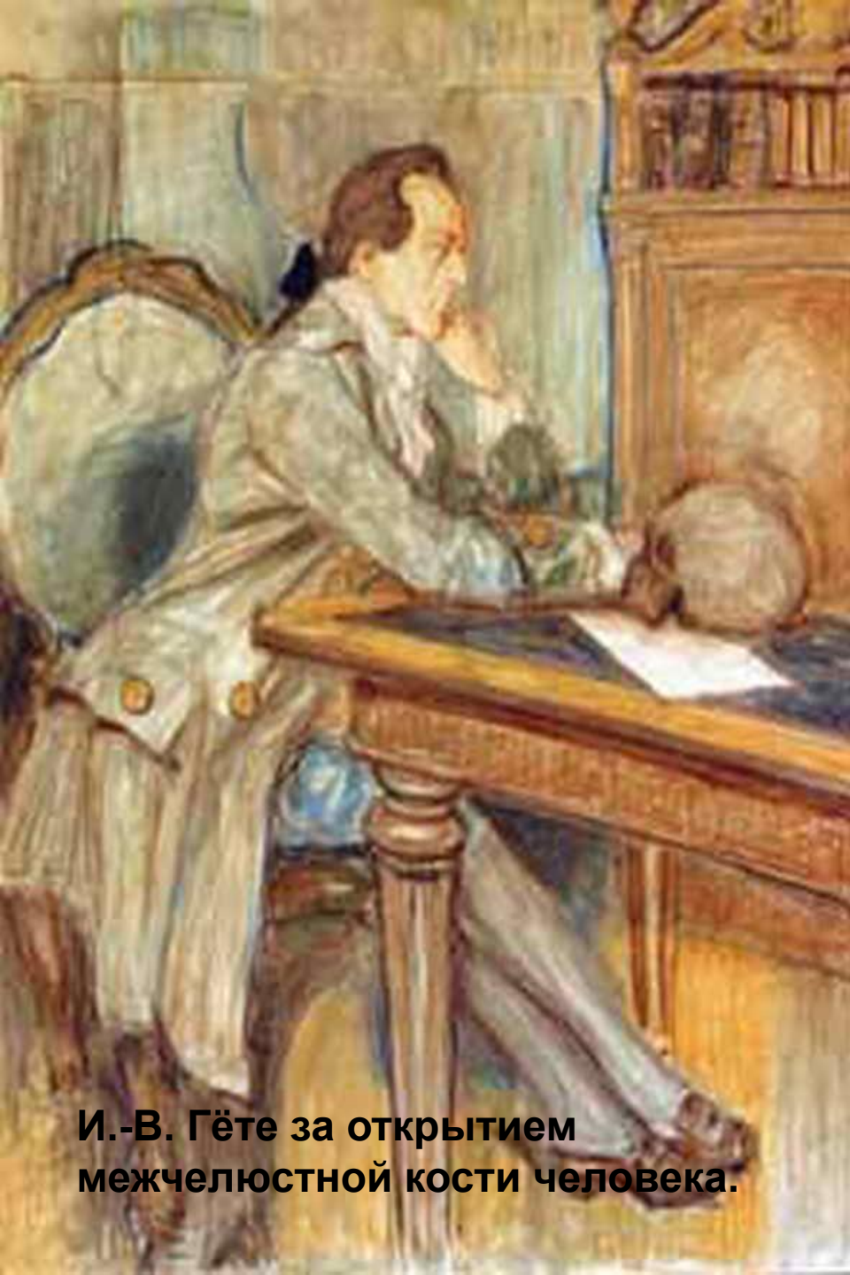
И.-В. Гёте за открытием межчелюстной кости человека.

Идея прогресса была в высшей степени близка поэту.