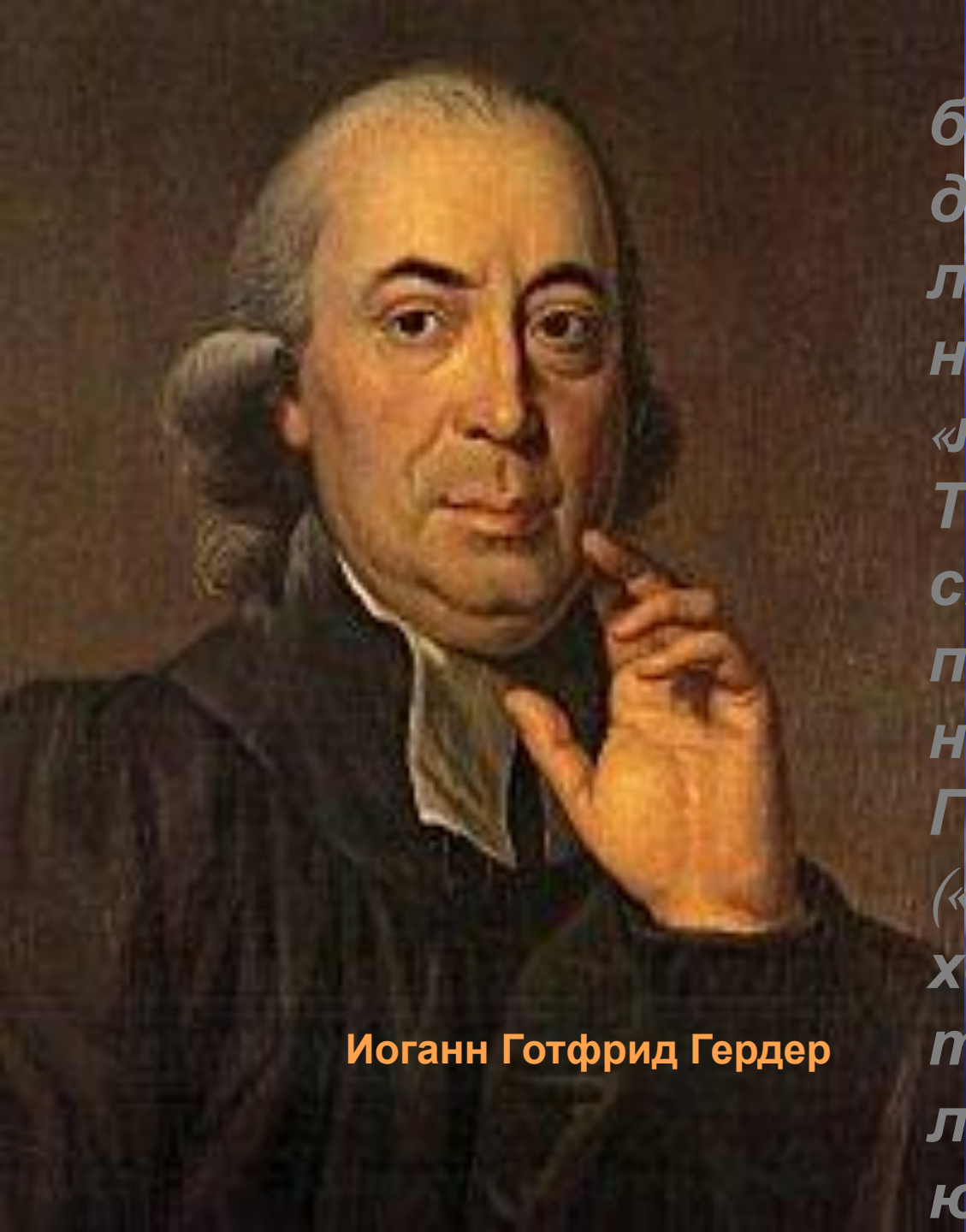
Иоганн Готфрид Гердер

Многие, казалось бы, прозорливые и доброжелательные люди столь часто называли поэта «легковесным». Так считал даже его старший друг и почитаемый наставник Иоганн Готфрид Гердер («Гёте и вправду хороший человек, только крайне легкомыслен»). В юности поэт получал