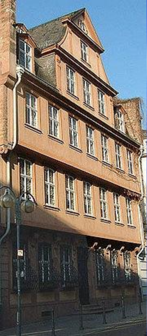
Дом во Франкфурте-на-Майне, где родился Гёте. Восстановлен в 1947—1949 годах.

Гёте родился 28 августа 1749 во Франкфурте-на-Майне. «В отца пошел суровый мой / Уклад, телосложение; В мамашу – нрав всегда живой / И к рассказням влечение», – писал он .