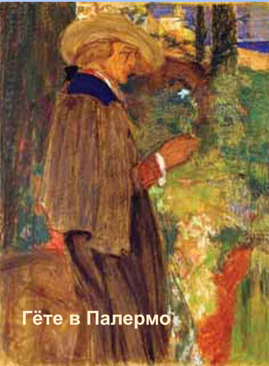
Гёте в Палермо

Те, кто знал его близко, отмечали повышенную впечатлительность и ранимость — признак как раз самого серьезного и глубокого восприятия жизни. Его ощущение бытия словно мечется между полюсами восторга и отчаяния (записи в юношеском дневнике: «Как все сумрачно на этом свете»: ЧУТЬ