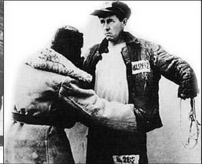
1. Особлаг (сразу по выходе), 1953 г.