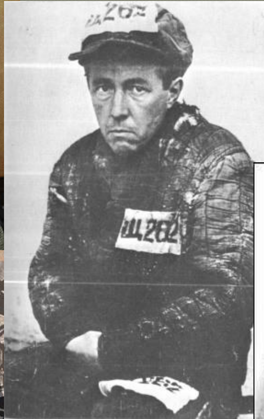
1. Особлаг (сразу по выходе), 1953 г.