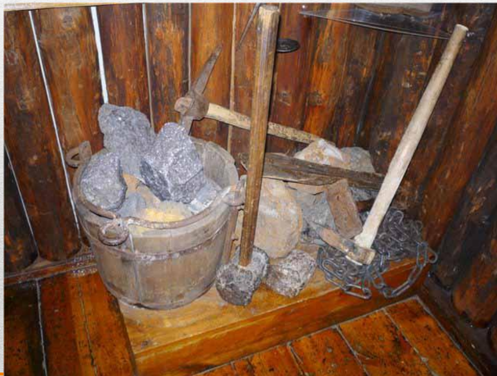
Каторжные орудия труда – Музей Декабристов

17 декабря он предстал перед приехавшими за ним посланцами Следственного комитета. Его объявили государственным преступником первого разряда, приговорили к смертной казни с отсечением головы. Смертная казнь была заменена 20 годами каторги и затем – вечным поселением в Сибири. Больше полутора лет Пущин провел в Шлиссельбургской крепости, потом был отправлен в Читту.