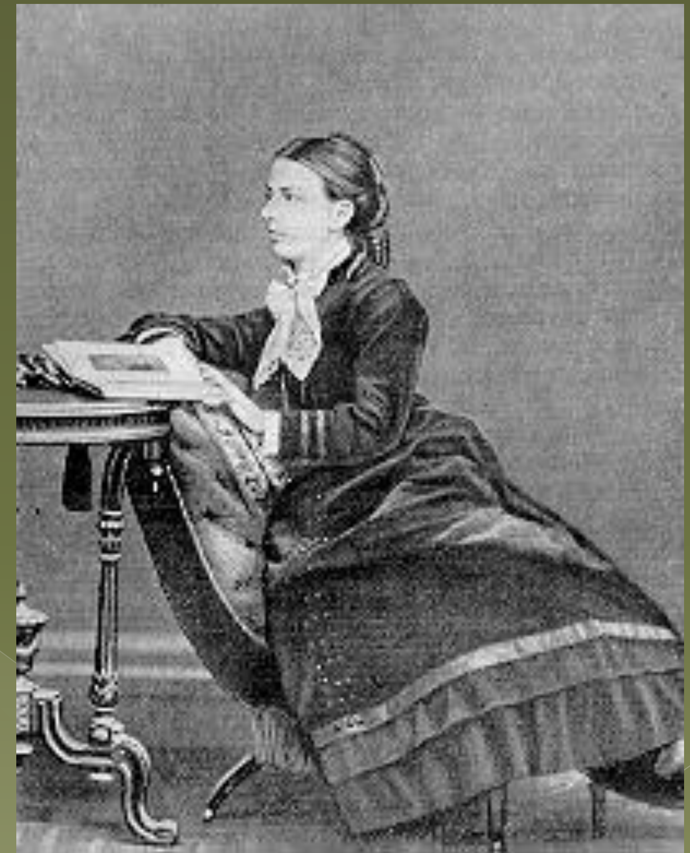
Софья Васильевна Ковалевская

В 1868, чтобы иметь возможность заниматься наукой, вступила в фиктивный брак (ставший позднее фактическим) с В. О. Ковалевским и в 1869 г. уехала в Гейдельберг, где изучала математику.