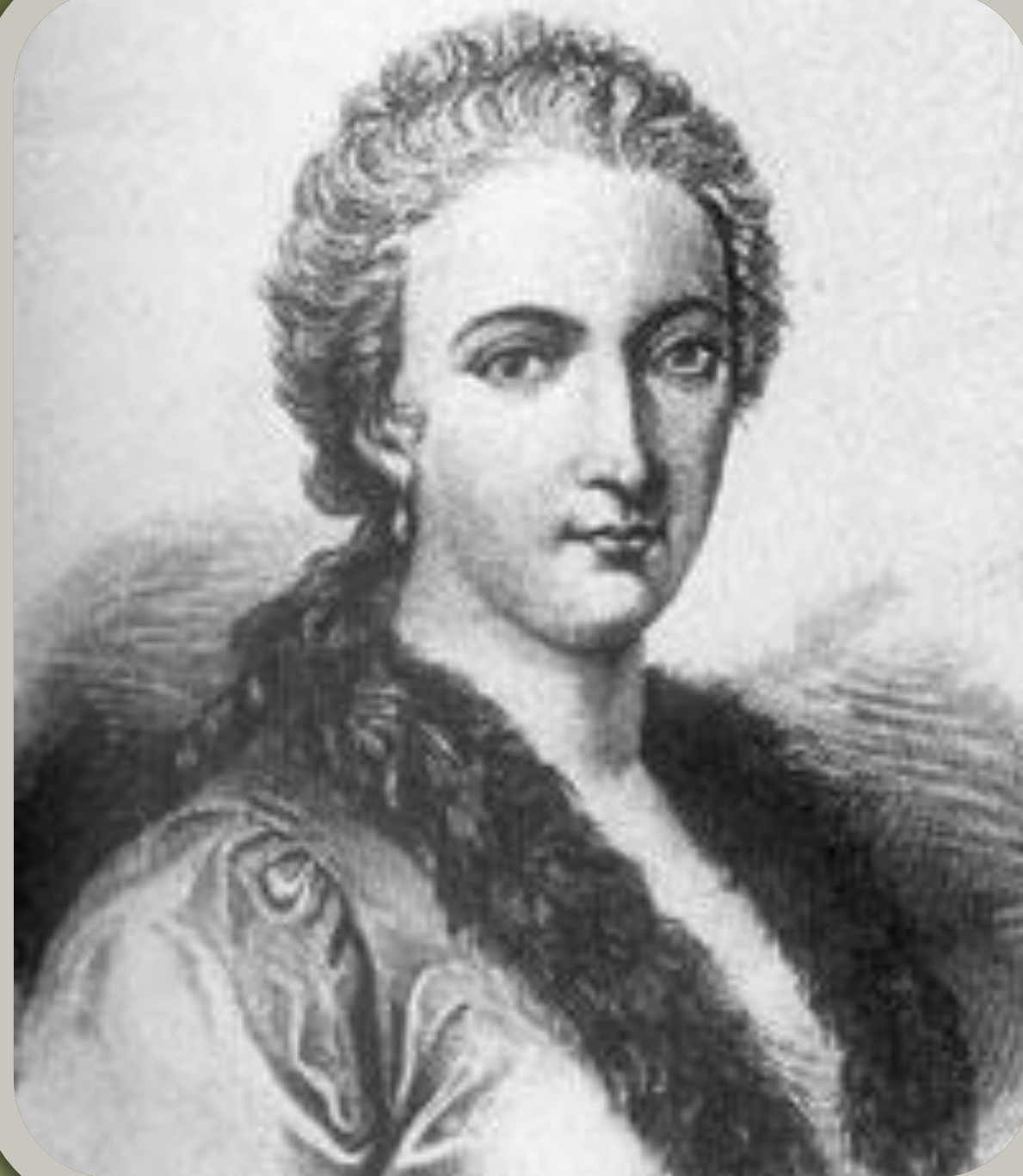
Мария Гаэтано Агнеси