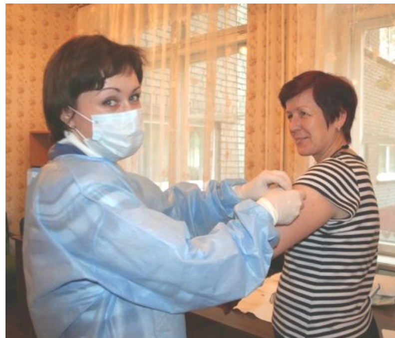
Вакцинация сотрудников гимназии