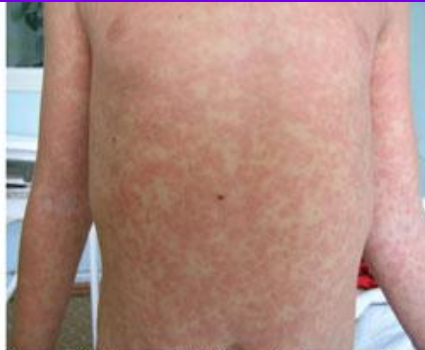
Рисунок 2. Пациент М., 11 лет. Инфекционный мононуклеоз, токсико-аллергический дерматит