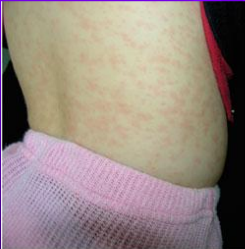
Рисунок 1. Пациентка М., 4 года. Корь, второй день высыпания