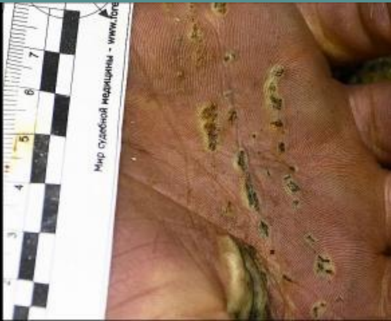
— Металлизация КОЖИ