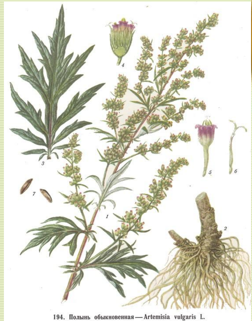
194. Полынь обыкновенная — Artemisia vulgaris L.

Трава чернобыльника содержит эфирные масла, витамины, дубильные, слизистые и смолистые вещества, а корни - эфирные масла, слизистые и сахаристые вещества. Высушенная трава имеет острый аромат, слегка горький и терпкий вкус. У корней тот же аромат, но вкус сладковато-острый.