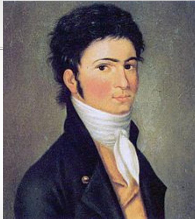
Бетховен в 30 лет.

«Ваши вещи прекрасные, это даже чудесные вещи, но то тут, то там в них встречается нечто странное, мрачное, так как Вы сами немного угрюмы и странны; а стиль музыканта — это всегда он сам.»