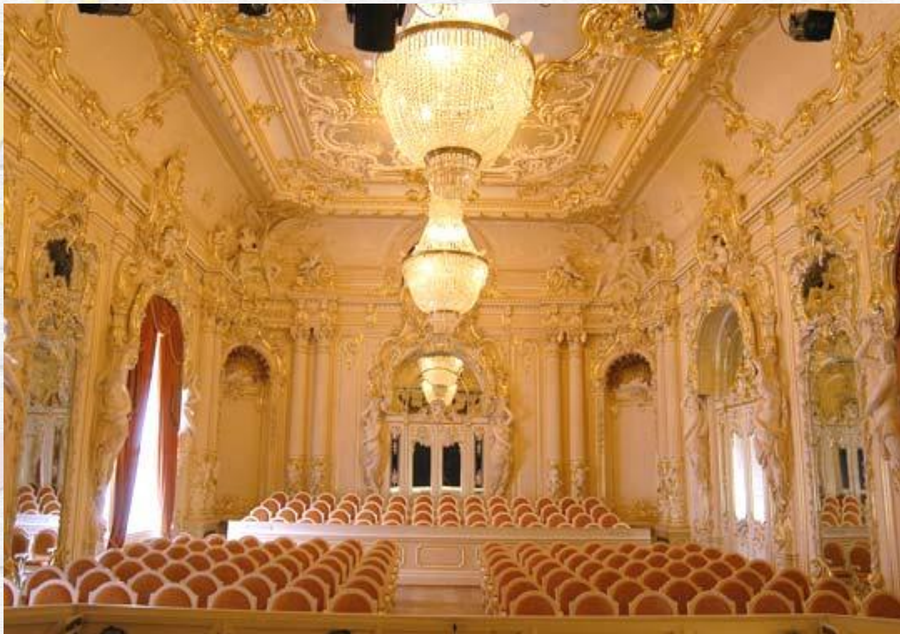
Камерный музыкальный театр в Санкт – Петербурге.