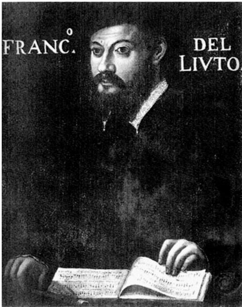
Франческо Канова да Милано (1497-1543)