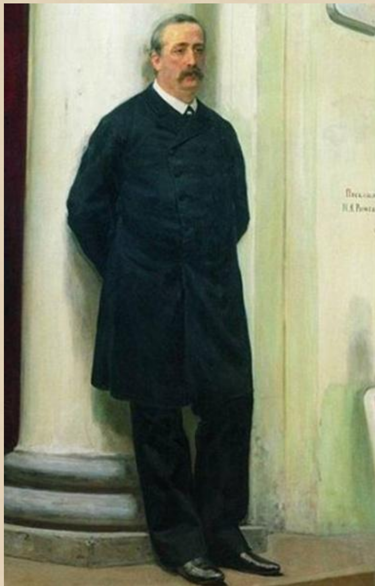
Александр Прокофьевич Бородин (1833-1887гг.)