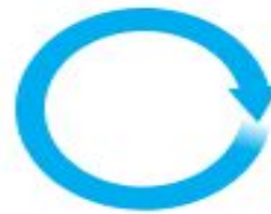
«круг»; «коло»; «колесо» — Смоленская обл. «шина» — Архангельская обл.