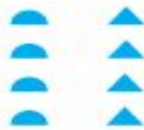
«колонна»; «шествие» — Архангельская обл.