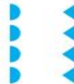
«улица» — Архангельская обл. «стенка» — Москва «проулочек» — Пермь