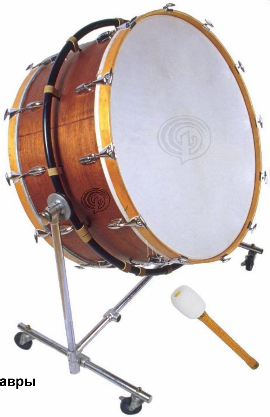
Охотники - литавры