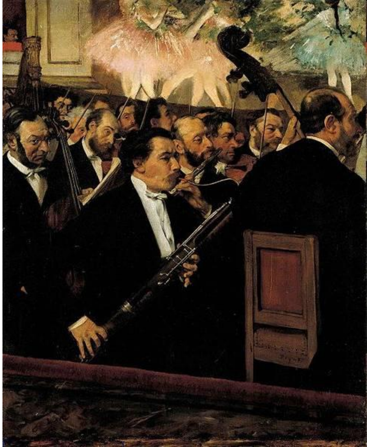
Дедушка – фагот