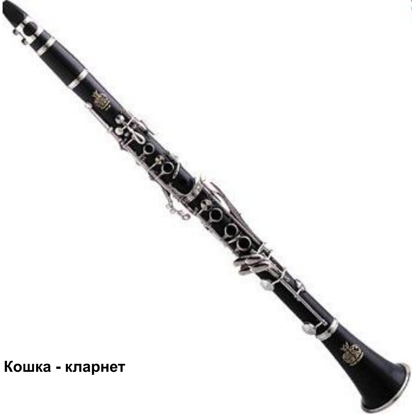
Кошка - кларнет