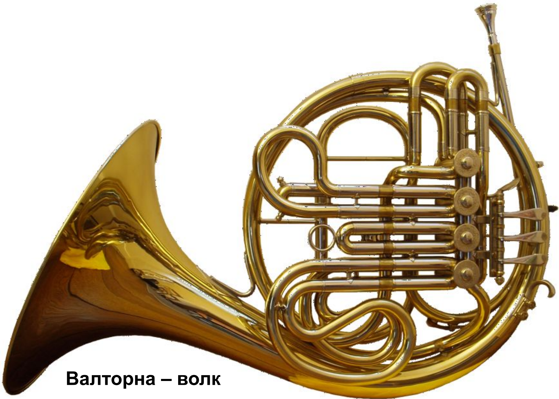
Валторна – волк