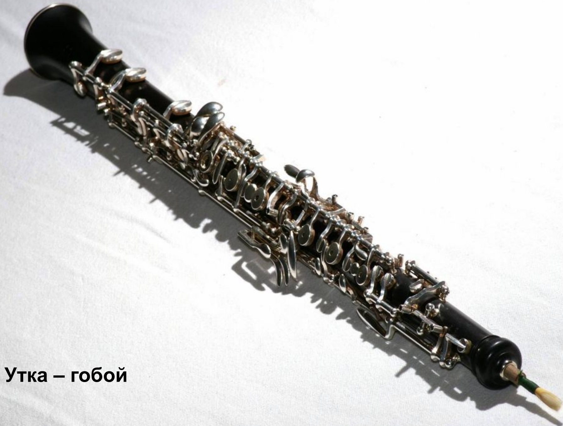
Утка – гобой