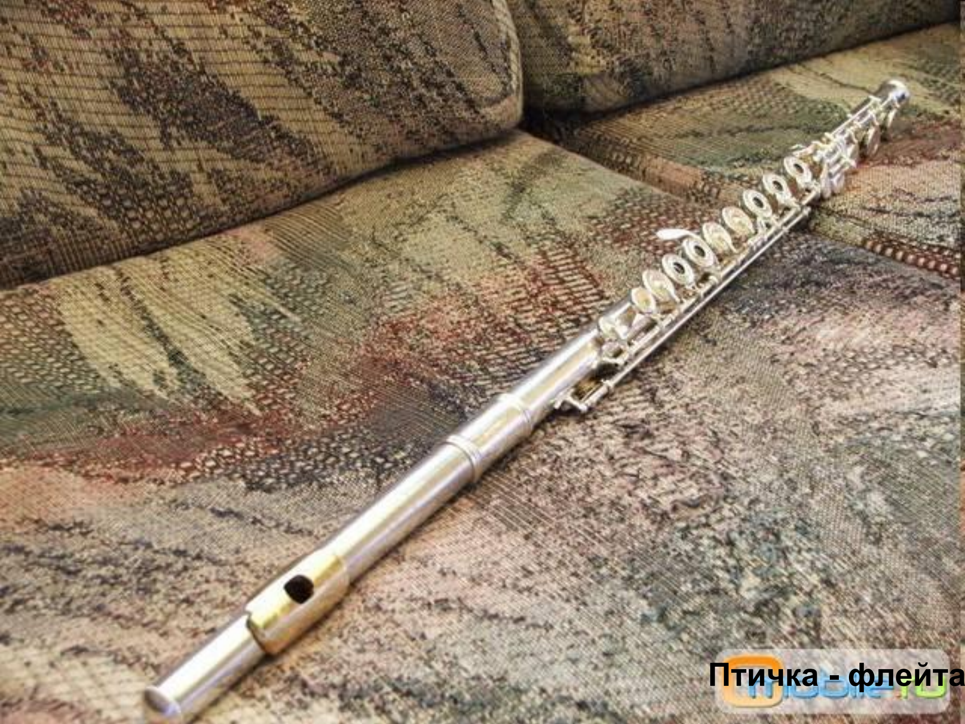
Птичка - флейта