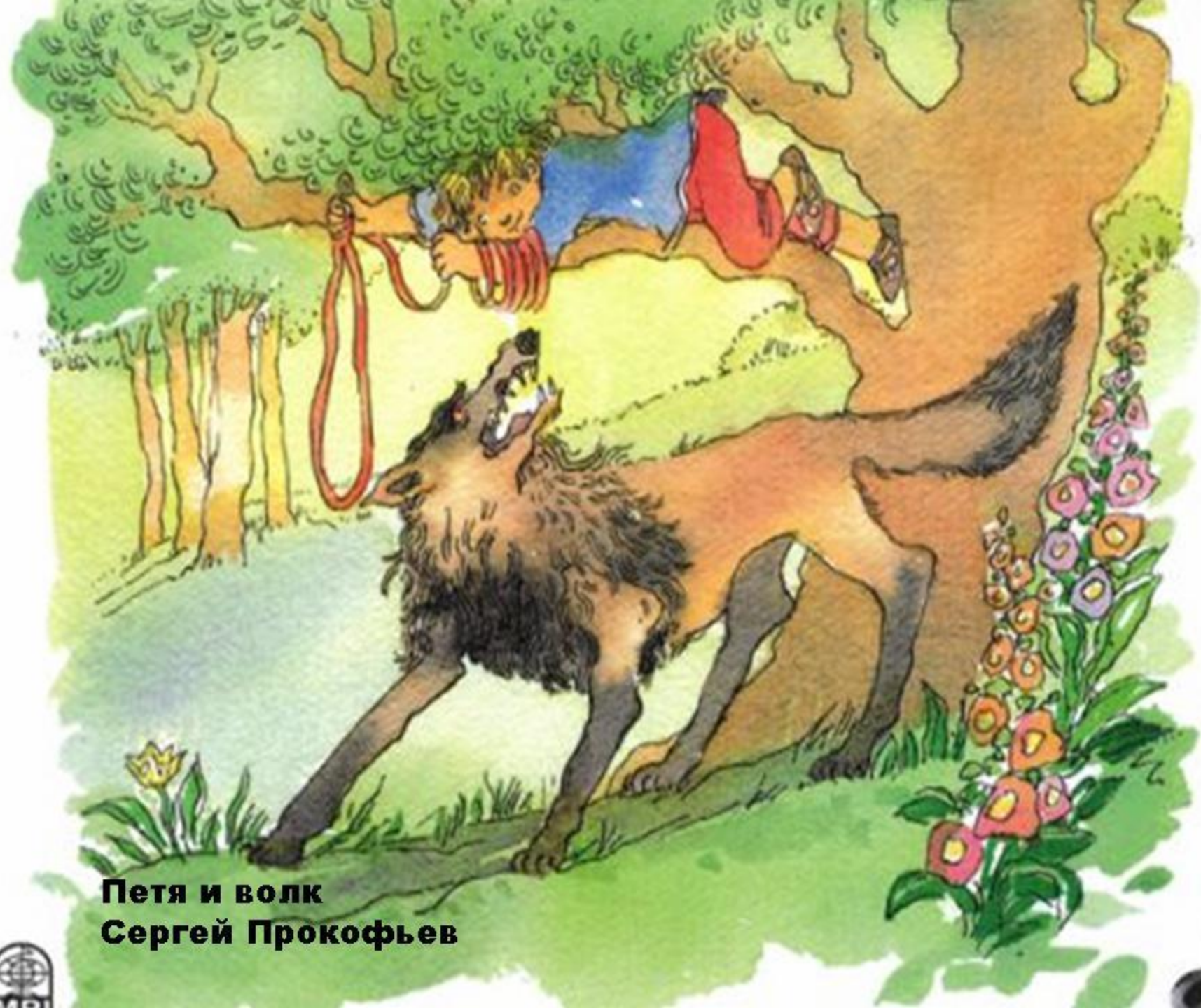
Петя и волк Сергей Прокофьев