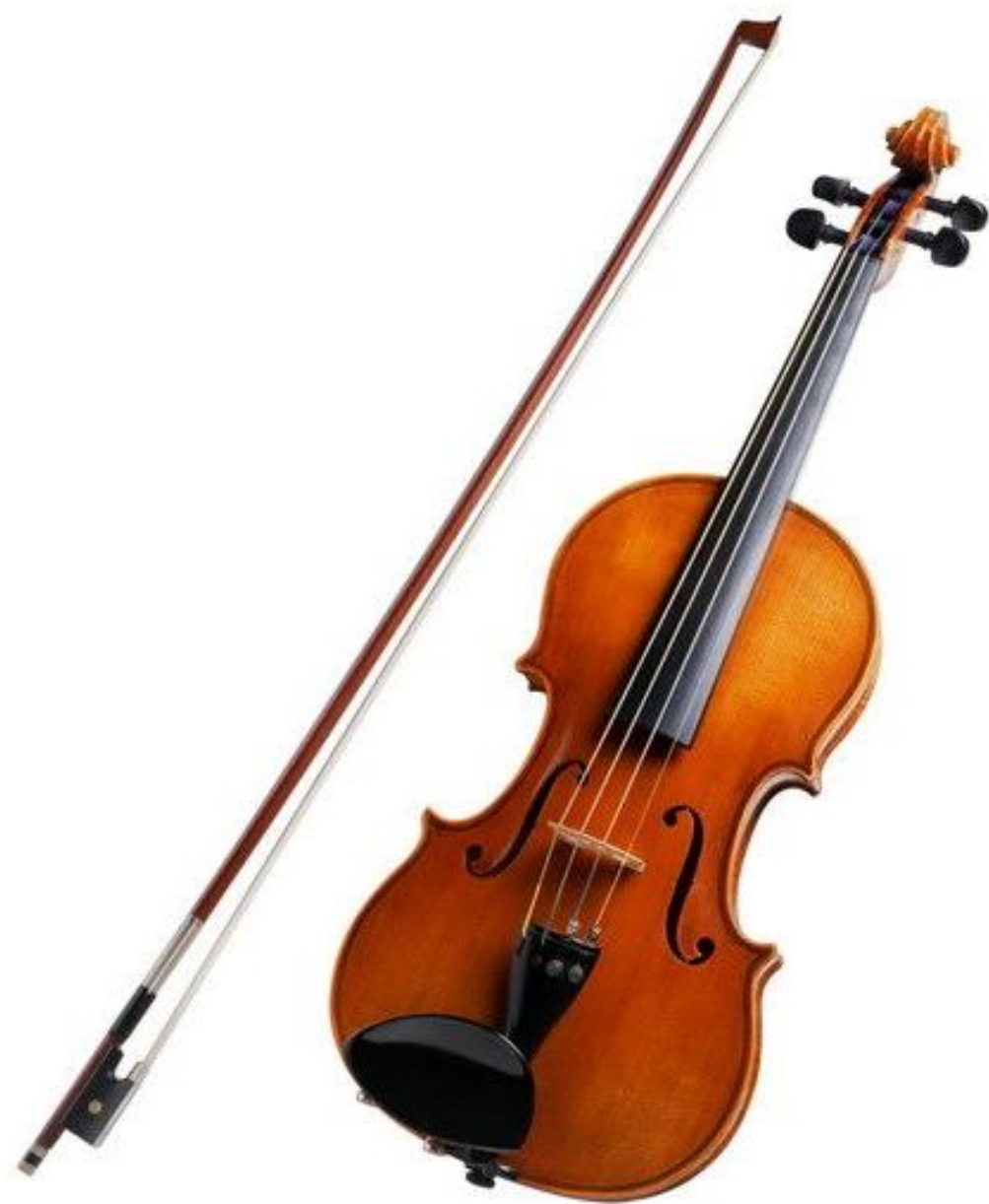
Петя - скрипка