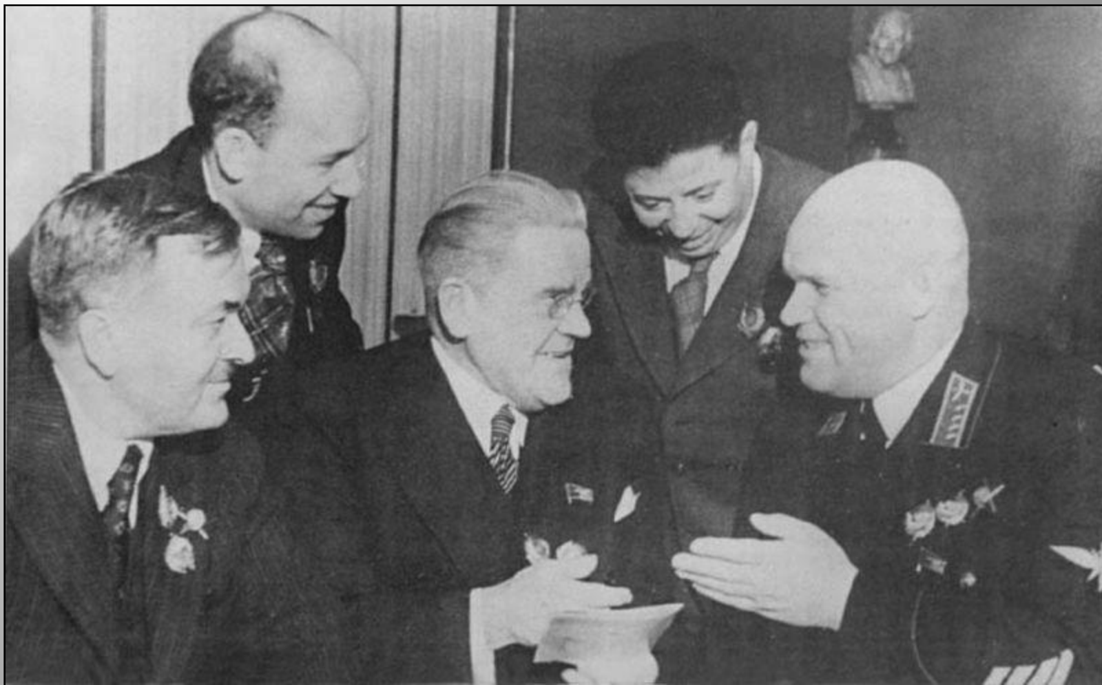
Командарм 2—го ранга А. Д. Локтионов, композиторы А. В. Александров, И. О. Дунаевский, Д. Я. Покрасс и артист И. М. Москвин (1938 год).