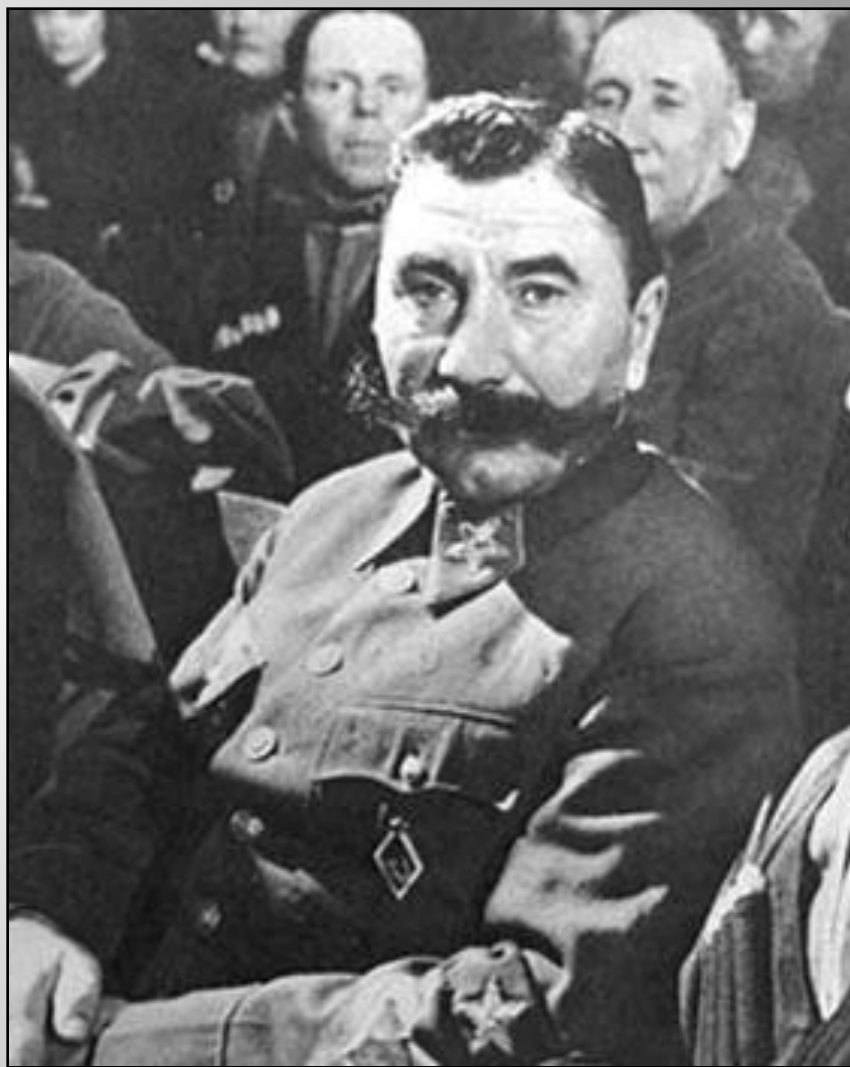
С. М. Буденный