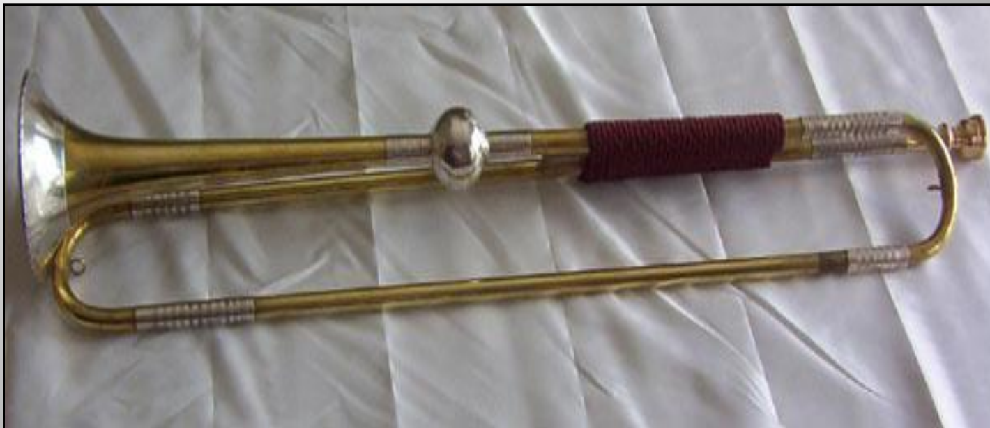
Труба эпохи барокко (реконструкция)