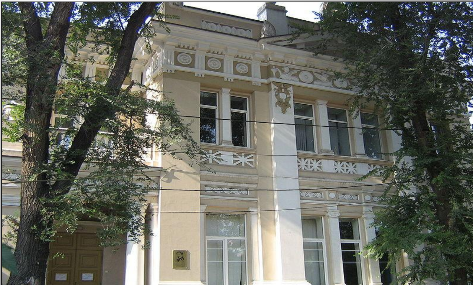
Училище им. М. Грекова