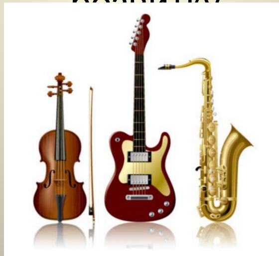
Вершиніна Л.Х. - вчитель музики Родинська ОШ№8