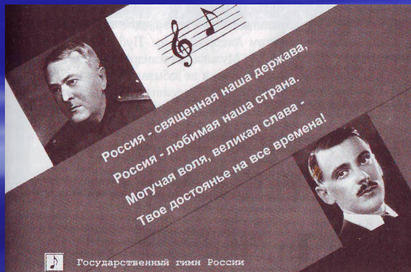
А.В.Александров, С.В. Михалков

К вопросу о гимне вернулись в 2000 году. Текст принадлежит С.В.Михалкову, а музыка осталась от прежнего гимна и принадлежит композитору и хоровому дирижеру А.В.Александрову. Государственный гимн РФ был утвержден Государственной Думой в декабре 2000 года. Текст гимна утвержден указом Президента РФ В.В. Путина 30 декабря 2000 года.