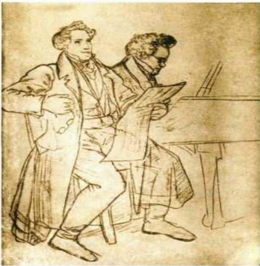
Фогль и Шуберт. Рисунок карандашом М.Швинда.

Літнє перебування в Желізі позитивно вплинуло на здоров'я Шуберта. Він написав там два опуси для фортепіано в чотири руки — сонату «Великий дует» до мажор і Варіації на оригінальну тему ля-бемоль мажор.