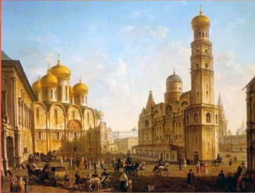
Ф.Я.Алексеев «Соборная площадь в Москве»