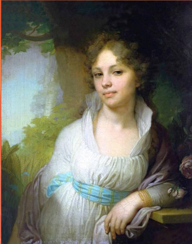
Вл.Боровиковский Портрет графини Лопухиной