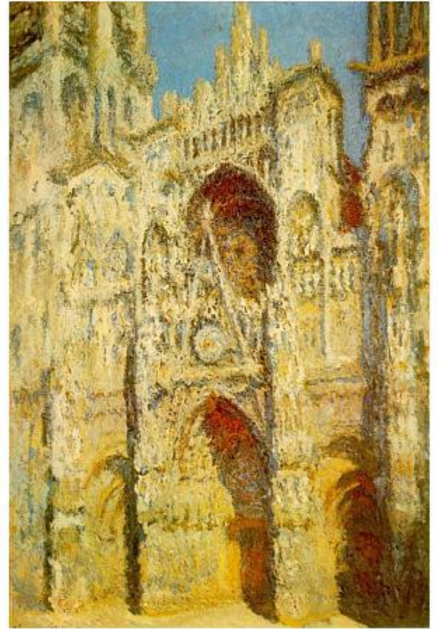
К.Моне «Руанский собор»