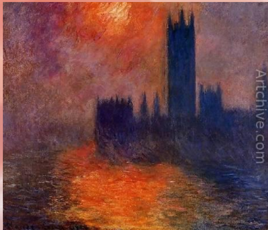
Лондонский парламент «Солнце, пробивающееся сквозь туман»