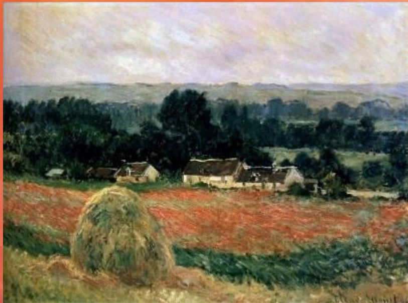
Стога в Живерни