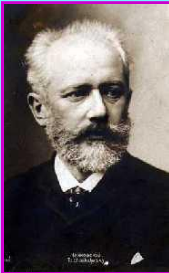
Петр Ильич Чайковский