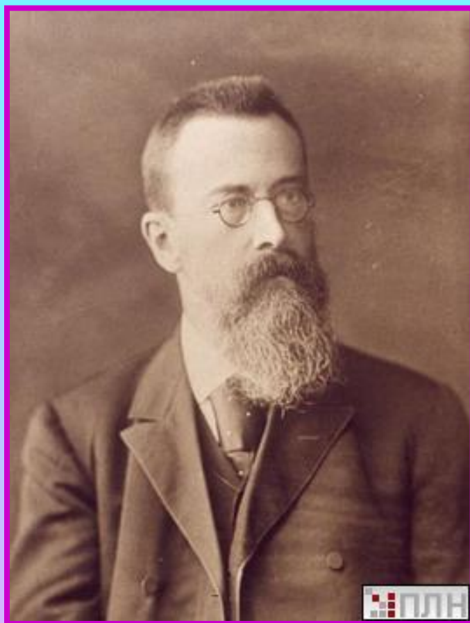
Николай Андреевич Римский-Корсаков