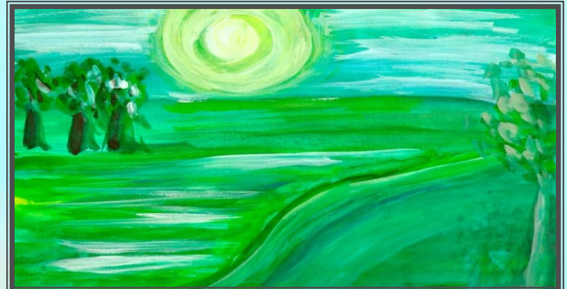
Такий "музичний живопис" допомогла зобразити музика П. Чайковського з циклу "Пори року"

Інтерес до музики найбільш зачаровує й хвилює