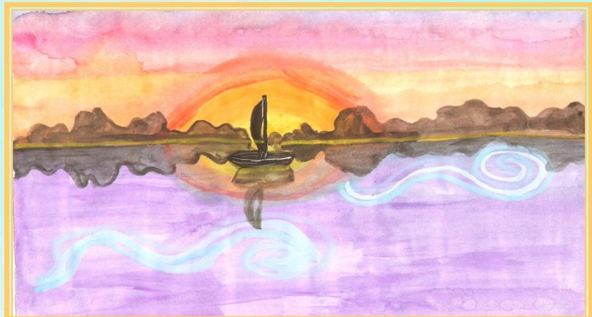
Музика Е. Гріга "Ранок" допомогла поетично намалювати пейзаж.

Інтерес до музики найбільш зачаровує й хвилює