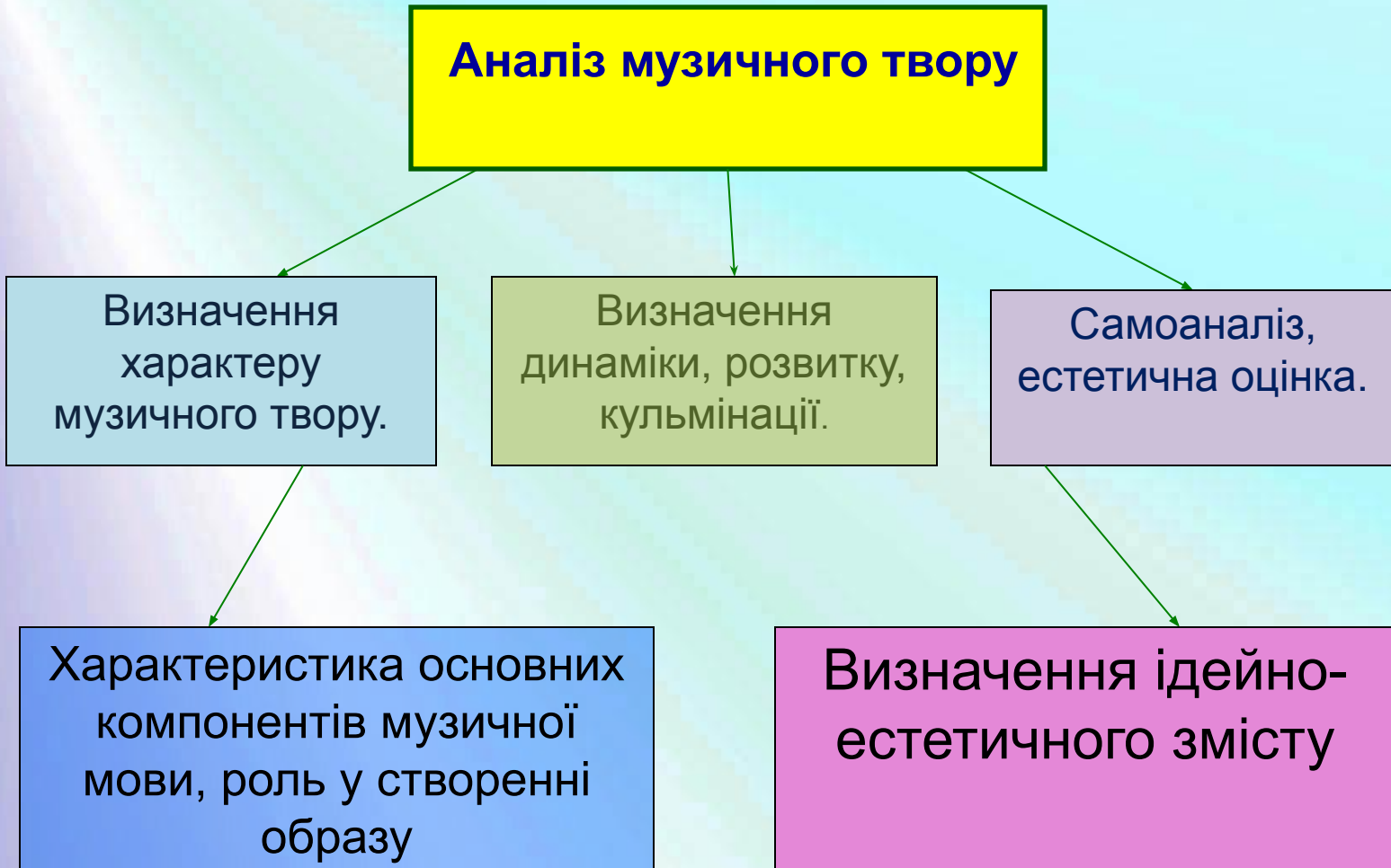
Схема аналізу музичного твору