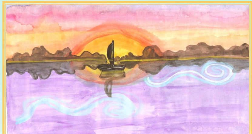
Музика Е. Гріга "Ранок" допомогла поетично намалювати пейзаж.

Інтерес до музики найбільш зачаровує й хвилює