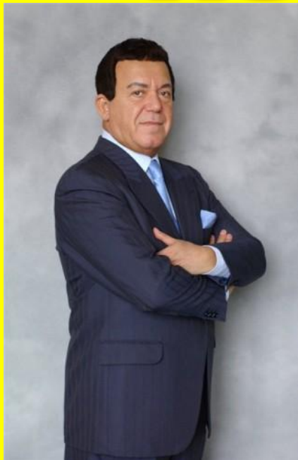
Иосиф Кобзон - заслуженный артист СССР