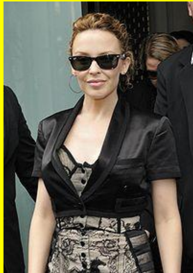
Кайли Энн Минóуг