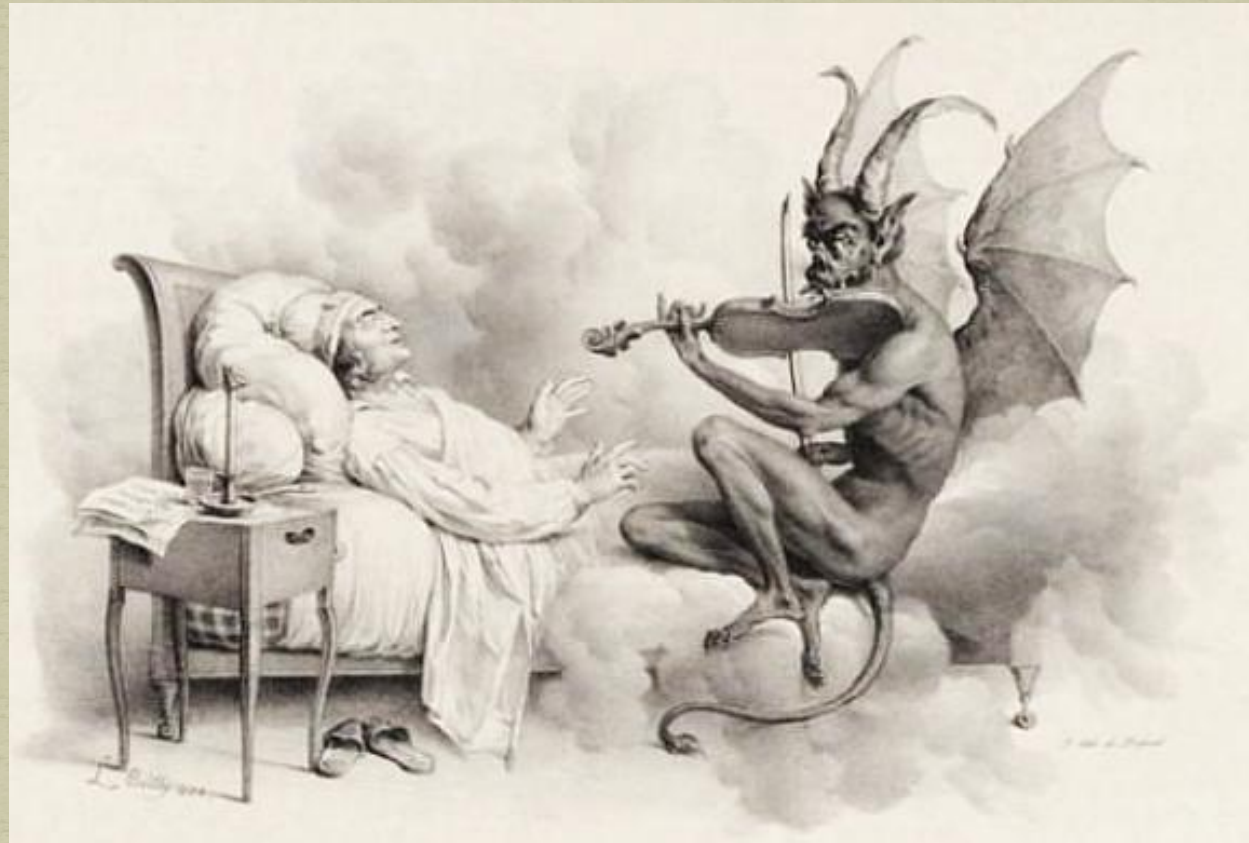
Соната «Трели дьявола»