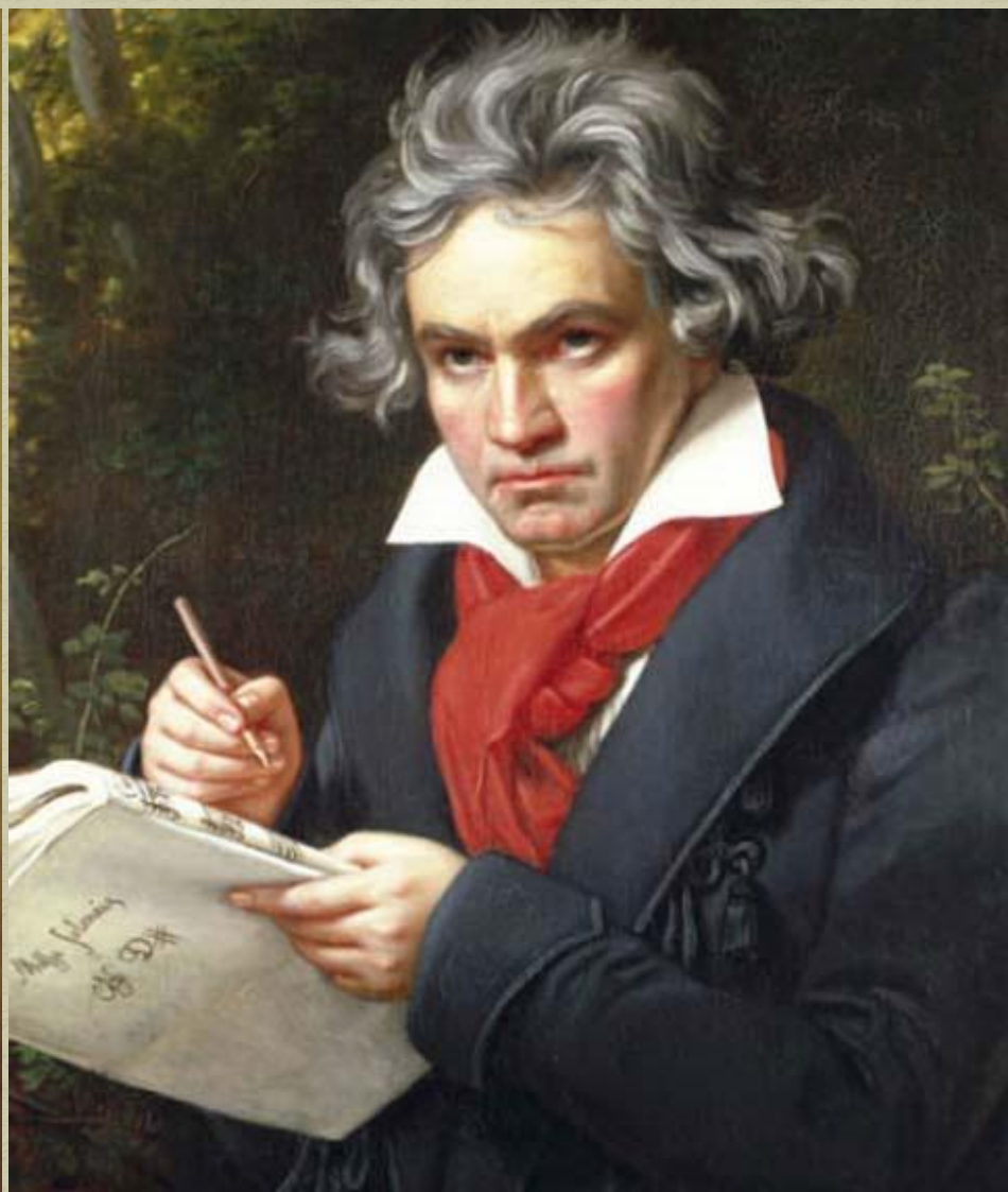
Людвиг ван Бетховен