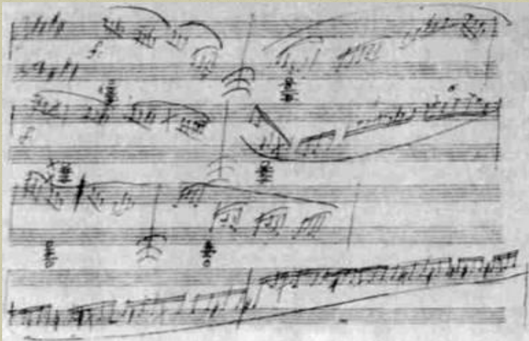
« Лунная соната» автограф