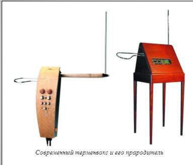
Современный терменвокс и его прародитель

В первых, классических моделях, созданных самим Львом Терменом, управление звуком происходит в результате свободного перемещения рук исполнителя в электромагнитном поле вблизи двух металлических антенн. Исполнитель играет стоя. Изменение высоты звука достигается путём приближения руки к правой антенне, в то время как громкость звука управляется за счёт приближения другой руки к левой антенне.