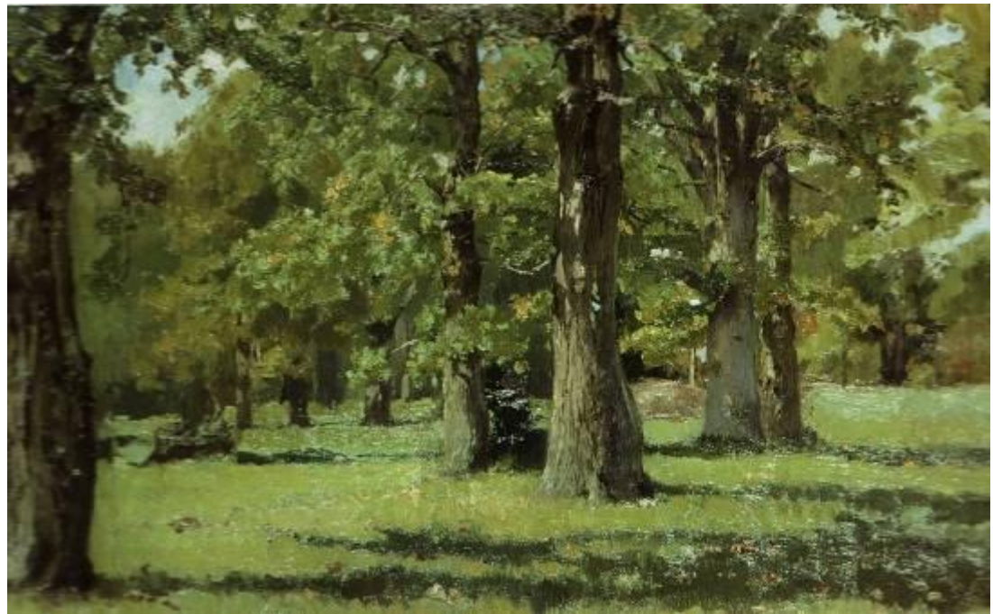
В.М.Васнецов «Дубовая роща в Абрамцево»