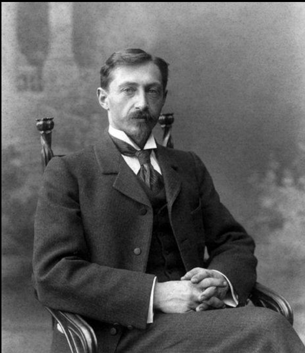
ПОРТРЕТ ПИСАТЕЛЯ И. БУНИНА. НИЖНИЙ НОВГОРОД.