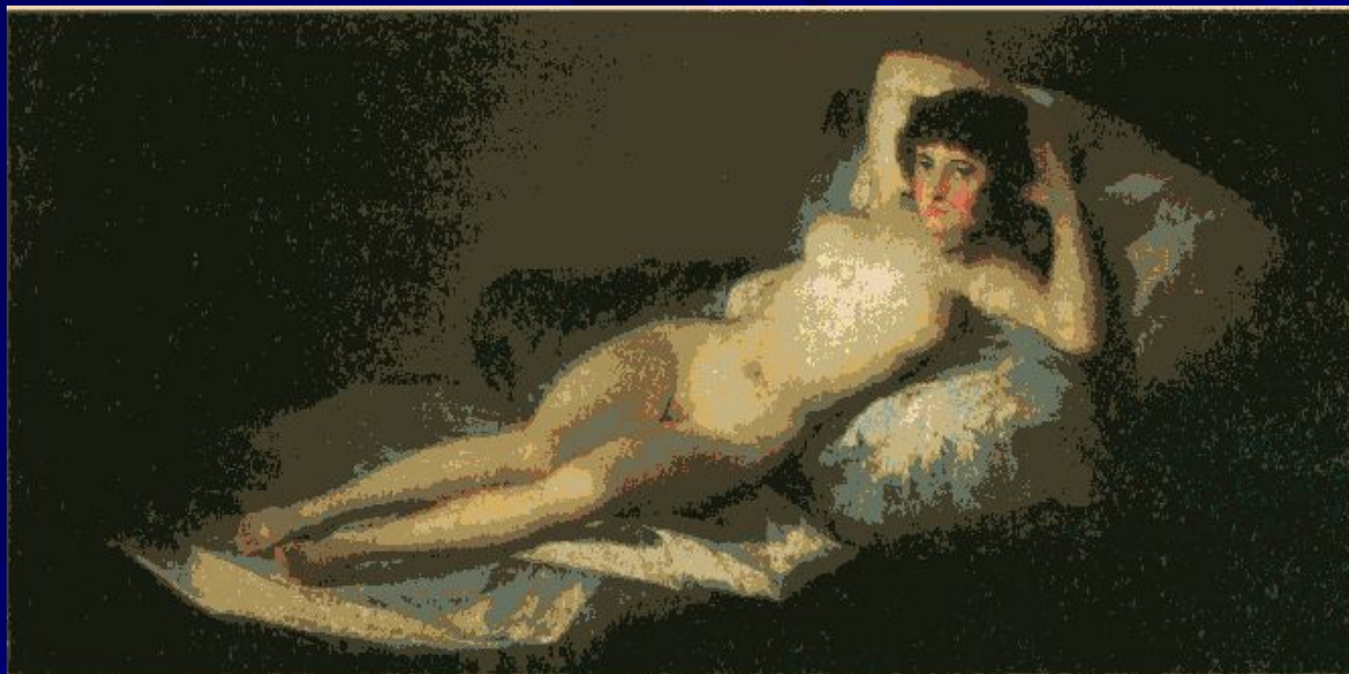
Франсиско Гойя. Обнажённая маха. Около 1802 г. Прадо, Мадрид.