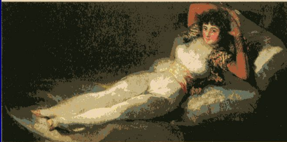
Франсиско Гойя. Одета маха. Около 1802 г. Прадо, Мадрид.