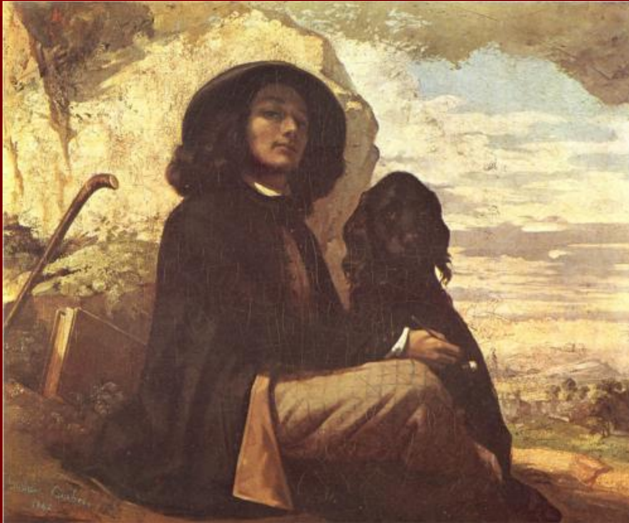
Автопортрет с черной собакой