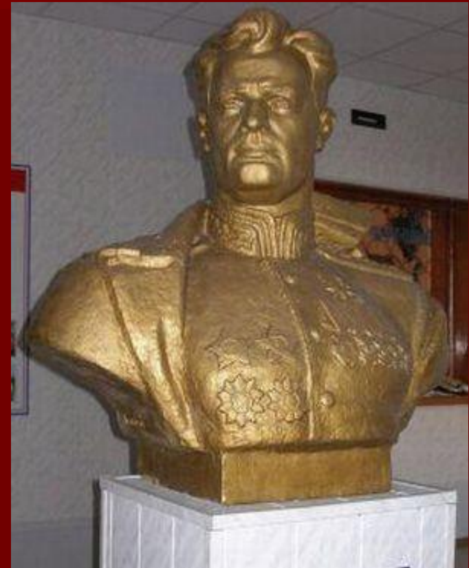
Бюст генерала И.Д. Черняховского