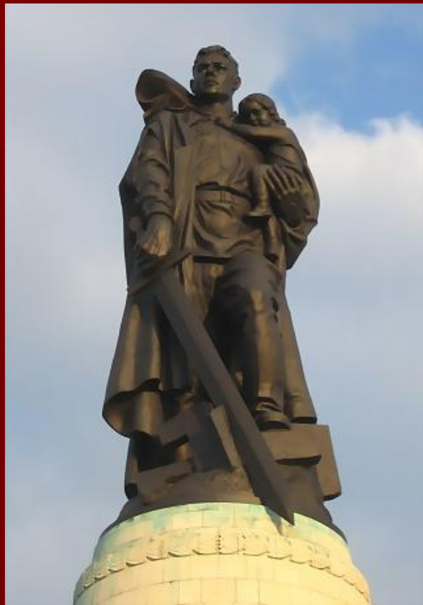
•Трептов - парк. «Воин-освободитель».