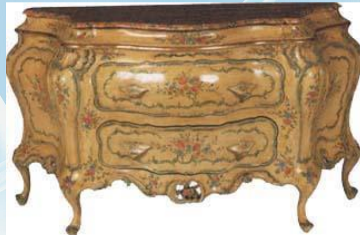
Комод. ИТАЛЬЯНСКОЕ РОКОКО.