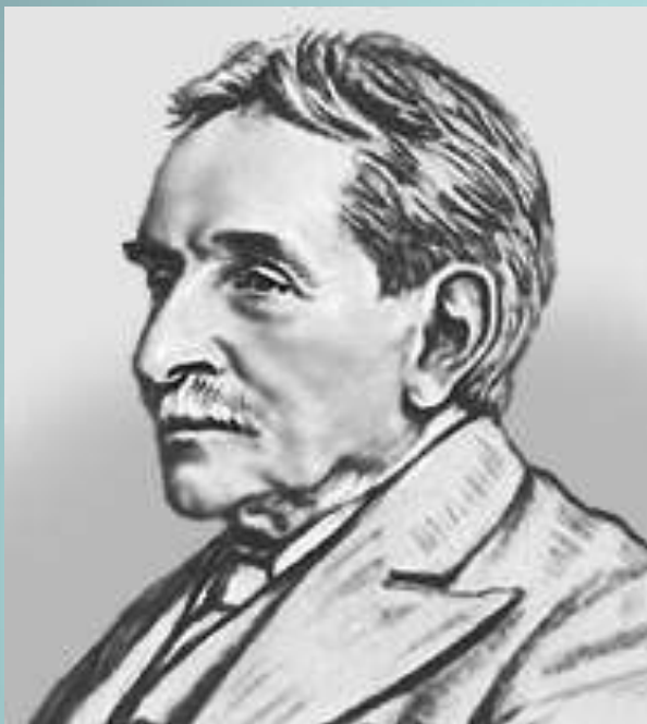
Артур Эванс Английский археолог Раскопки на острове Крит