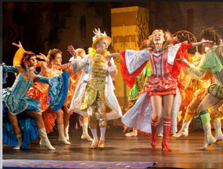
«Бременские музыканты» Г. Гладков

Многие мюзиклы и рок-оперы обрели свою вторую жизнь в кино и получили высокие кинематографические награды.