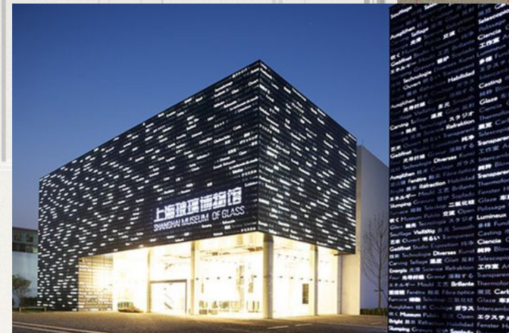
Музей стекла в Китае