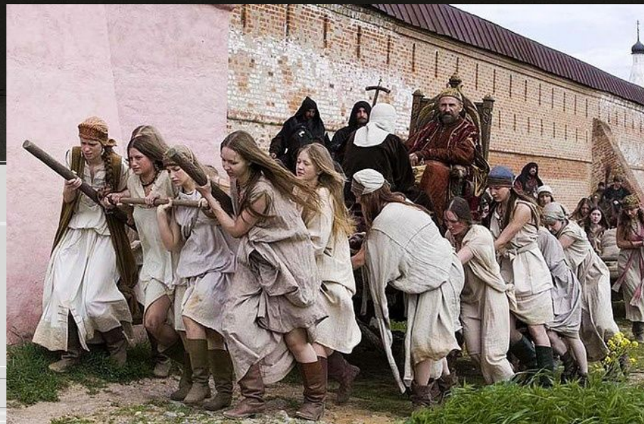
Сцена из фильма «Царь»

Эмоциональное переживание происходящих на сцене коллизий во много раз усиливается музыкой.