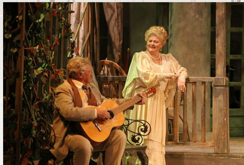
Сцена из спектакля в Малом театре