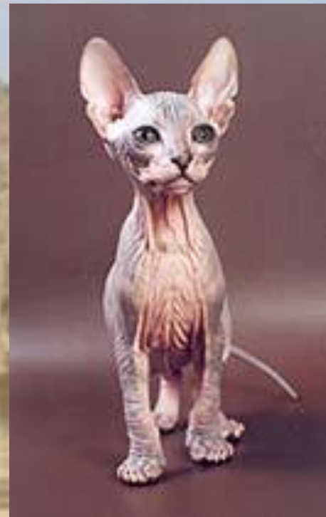
донской сфинкс (или донской лысак)