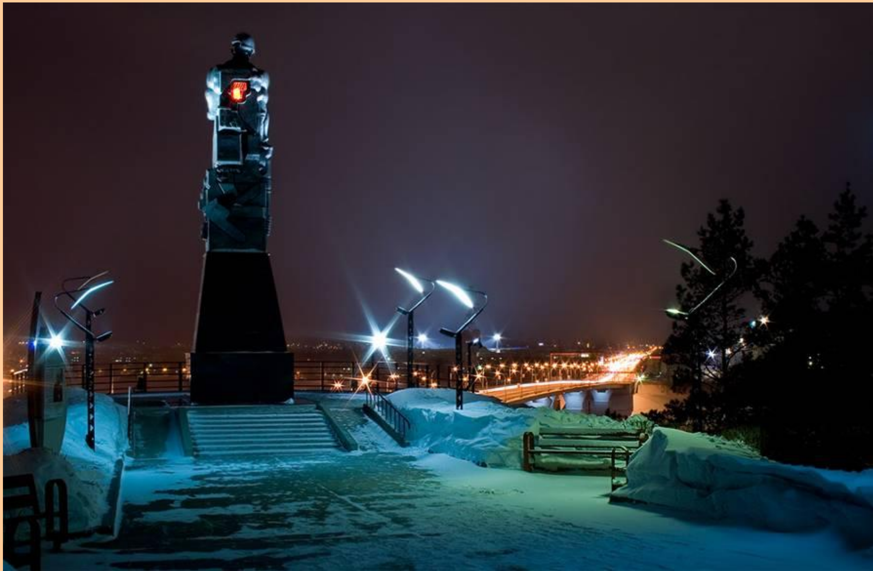
Фонари города Кемерово.