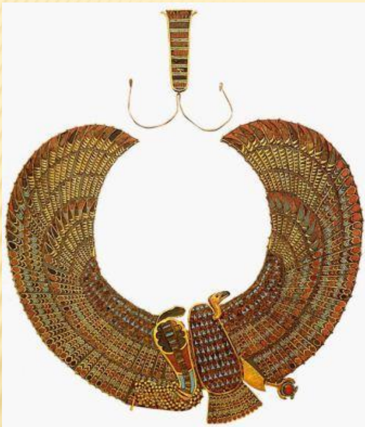
Ожерелье с изображениями грифа и кобры