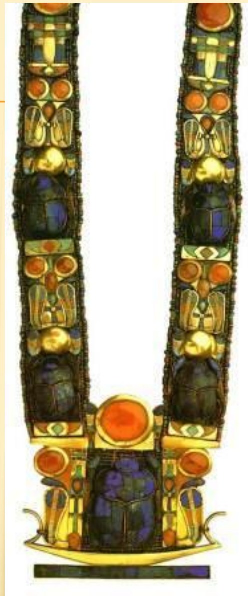
Ожерелье с изображением священных жуков- скарабеев