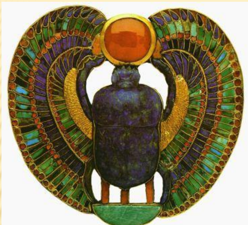
Оправа зеркала Анх или Крест жизни