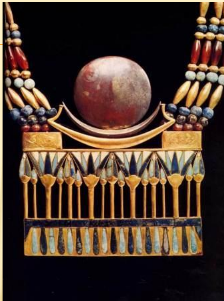
Деталь ожерелья (пектораль)