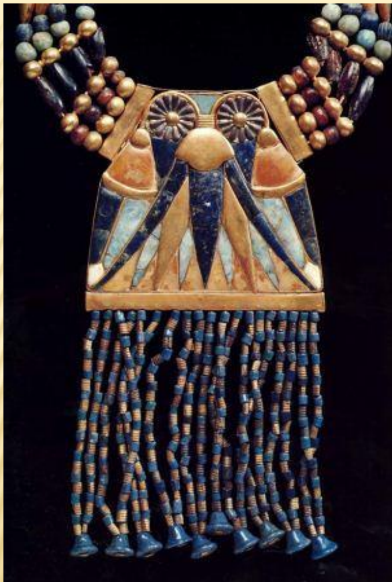
Деталь ожерелья (застежка- противовес)