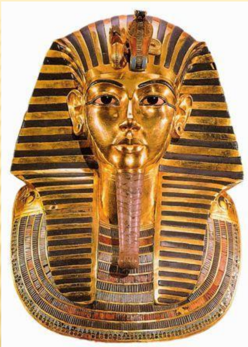
Погребальная маска египетского фараона Тутанхамона

У фараона были древнейшие головные уборы, которые практически не менялись во все времена, корона из двух частей (символы Нижнего и Верхнего царств) — атев, украшенная изображением коршуна и змеей — уреем — символом власти. Стоит отметить, что корон у фараона было великое множество (судя по дошедшим до нас фрескам, более 20), для различных религиозных обрядов, охоты, ведения военных операций. Другими царскими регалиями была треххвостая плеть и скипетр (в виде крючка). Следует заметить, что одним из символов власти фараона была борода, которая была искусственная, ее крепили за ушами завязками