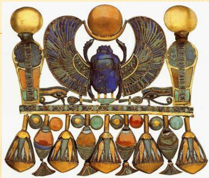
Пектораль с изображением священного жука-скарабея в окружении царских уреев и растительным орнаментом

Поскольку египтяне верили в загробную жизнь, украшения полагались и мертвым. Для погребальных церемоний изготавливались специальные медальоны в форме жуков скарабеев – символов воскрешения и жизни.