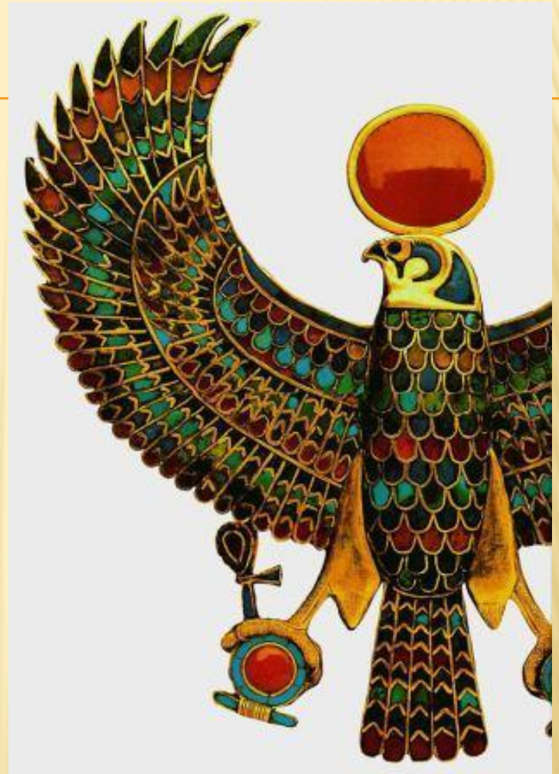
Пектораль с изображением божественной птицы - сокола