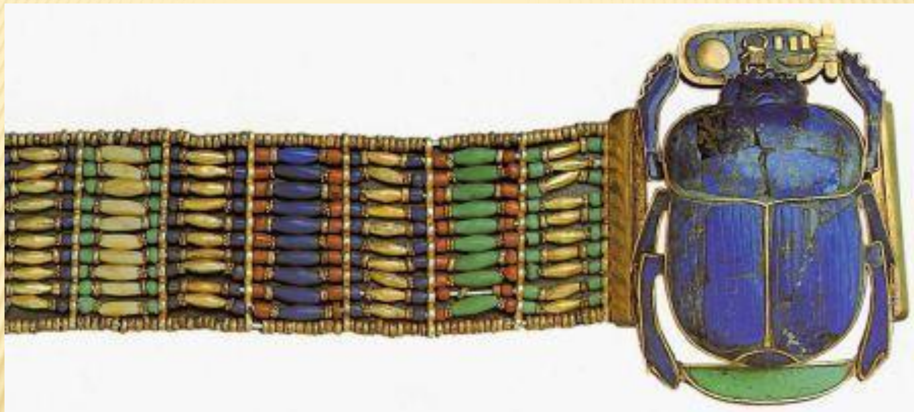
Браслет с застежкой в виде жука-скарабея