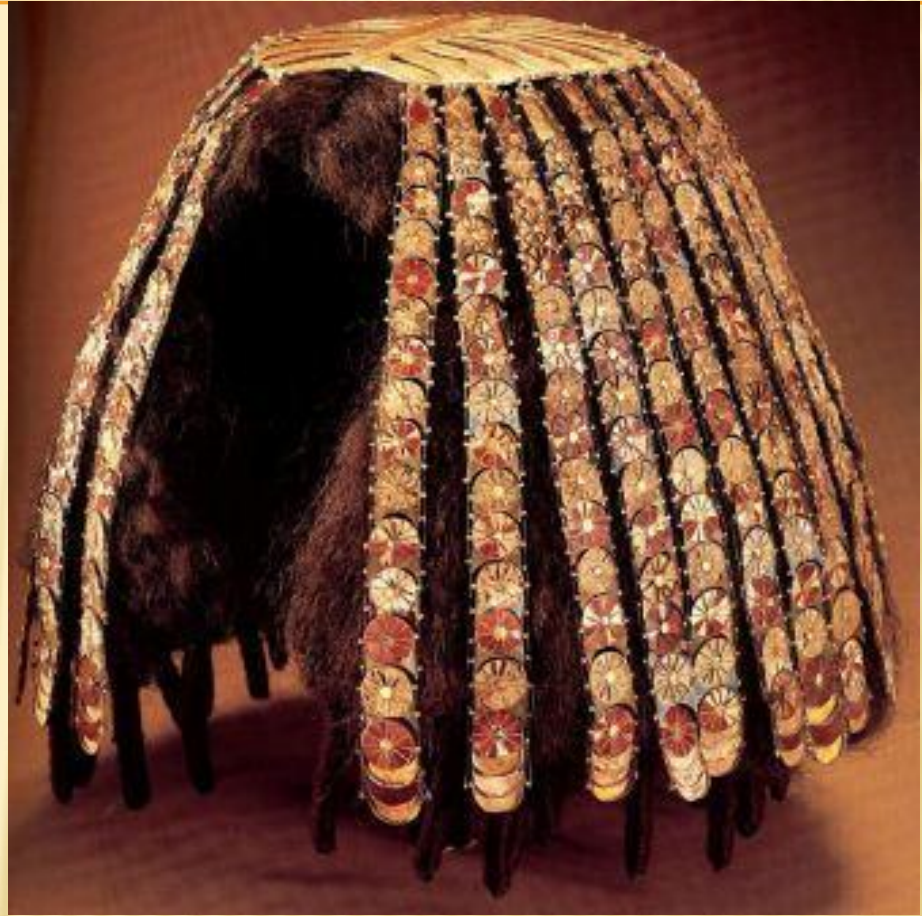
Головной убор царицы

Знать использовала гребни и шпильки из дорогого железа, люди менее состоятельные – гребни из кости, которые могли быть оформлены камнями или стеклом. В натуральные волосы и в парики могли вплетаться золотые украшения и цепочки. Также их украшали обручами из разных материалов.