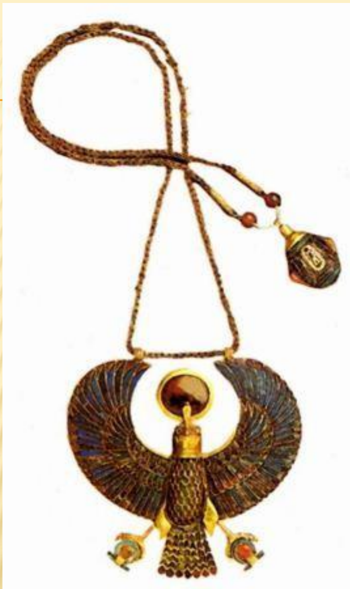
Ожерелье с изображением божественной птицы - сокола