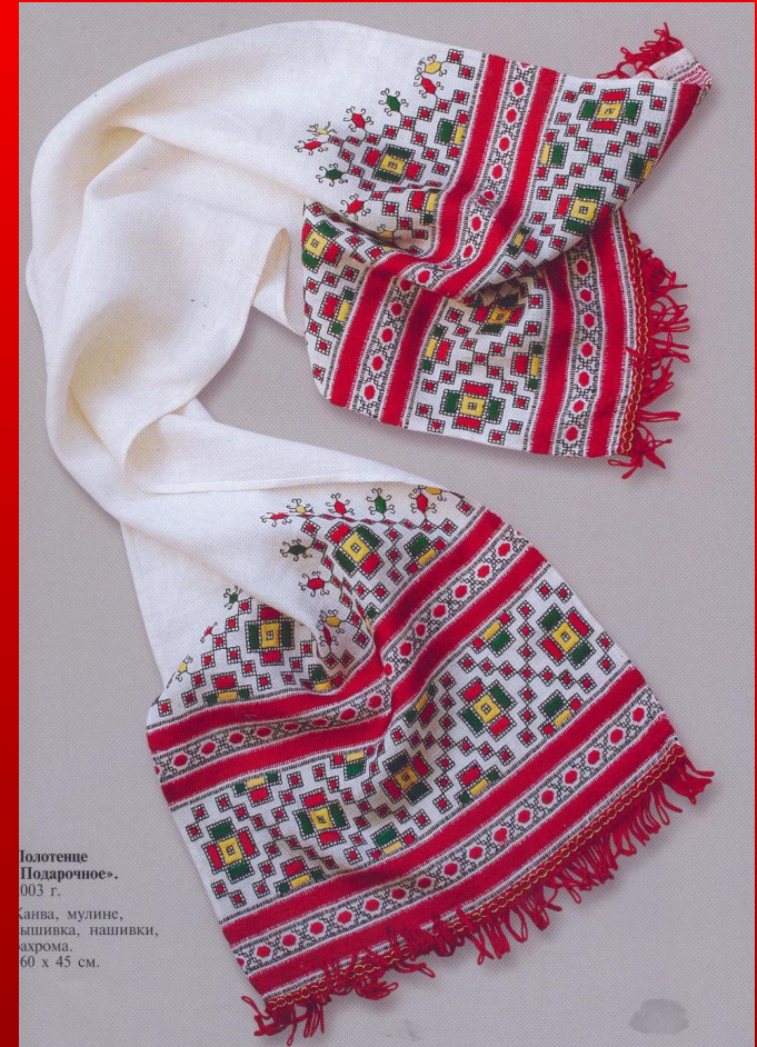
Полотенце «Подарочное». 003 г.

В элементах орнамента чувашской вышивки ученые-исследователи обнаружили знаки древней письменности. Изображения бытия в виде Древа жизни и первобытные понятия о Земле, небесном своде и светилах претали здесь в геометрических линиях и пропорциях узорного шитья.