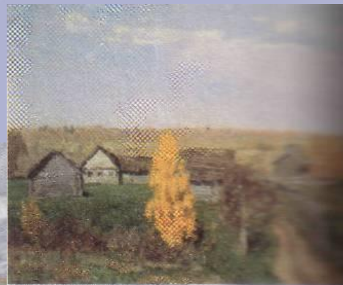
Золотая осень. Слободка.