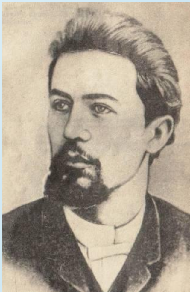
А.П.Чехов. 1891 год

Чехову шел тридцать второй год. Высокий, стройный, с веселым, открытым и необыкновенно симпатичным лицом, он не суетился, не радушичал, не старался во что бы то ни стало казаться остроумным и интересным. Природный ум, привлекательность оборачивались сдержанностью и спокойным тоном, приветливым обращением. Голос – звучный с басовитыми нотками. Быстрый взгляд его чудесных глаз был приветлив и открыт, по-юношески чуть насмешлив. Удостоенный Пушкинской премии Академии Наук, автор серьезных произведений, он все еще сохранял многое от Антоши Чехонте.