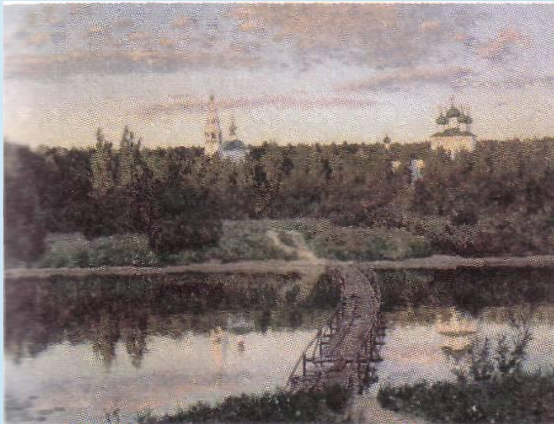
И.Левитан «Тихая обитель,» 1891 год

«Его картина «Тихая обитель» производит фурор. Во всяком случае успех Левитана не из обыкновенных»