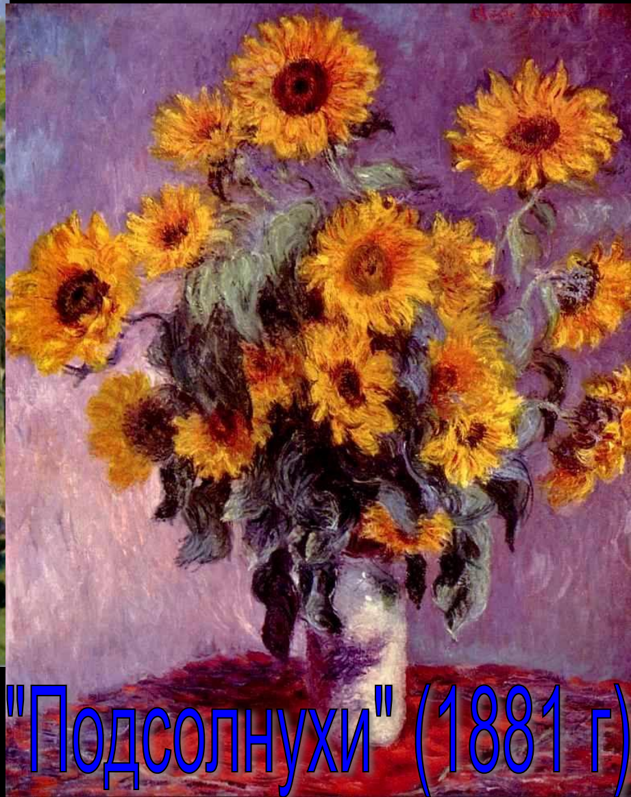
"Подсолнухи" (1881 г)