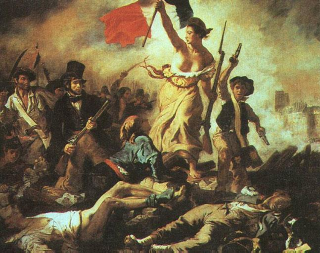
Эжен Делакруа "Свобода на баррикадах". 1830 г.

Только одна картина художника была написана непосредственно после современных ему событий - революции 1830 г. Она стала самым значительным и самым известным его произведением - "28 июля 1830 года" (" Свобода на баррикадах ", 1830, Лувр, Париж). Ее романтическая революционная символика, выраженная аллегорической фигурой Свободы с развевающимся национальным знаменем в руке, открыто призывала к борьбе и вселяла уверенность в неизбежной победе. Экспрессия и динамическая пластика полотна достигаются за счет использования лаконичных художественных приемов: композиция не перегружена изображением человеческих фигур, напряженная энергетика цветовой гаммы создается ударами красного и синего тонов.