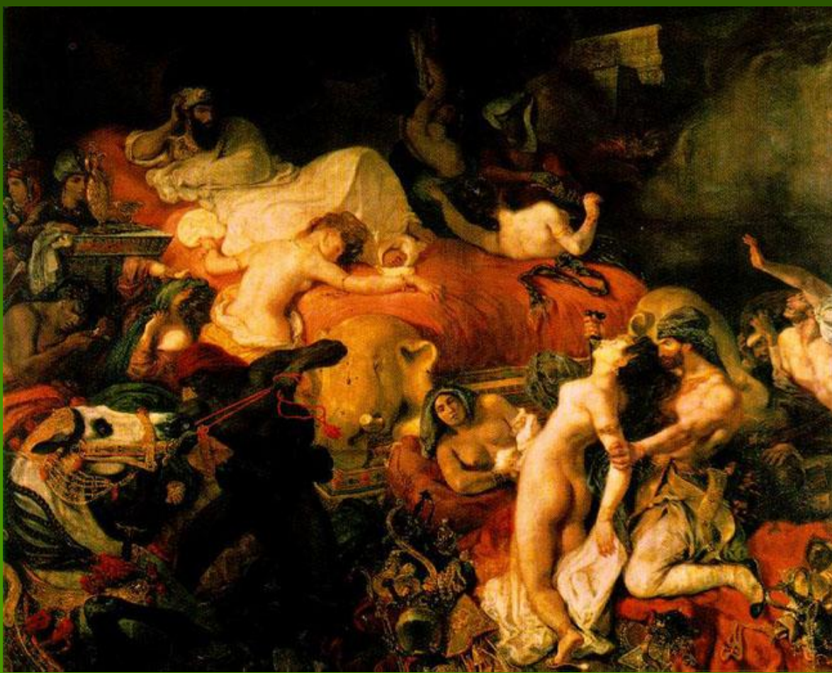
Эжен Делакруа "Смерть Сарданапала". 1827 г.

Во время пребывания в Англии (1825) Э.Делакруа знакомится с ее литературой, живописью и театром, большое впечатление на него производит творчество Дж.Констебла, Дж.Байрона и У.Шекспира. Впечатления от этого путешествия вылились в целый ряд картин, при написании которых он использовал новые живописные методы, заимствованные им у английских мастеров ("Тассо в доме умалишенных", 1825, Собрание Уоллес, Лондон; "Казнь дожа Марино Фальеро", 1826, Собрание Уоллес, Лондон; "Смерть Сарданапала" , 1827, Лувр, Париж),