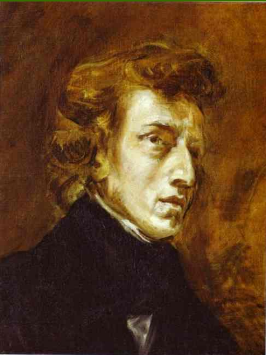
Эжен Делакруа "Фредерик Шопен". 1838 г.