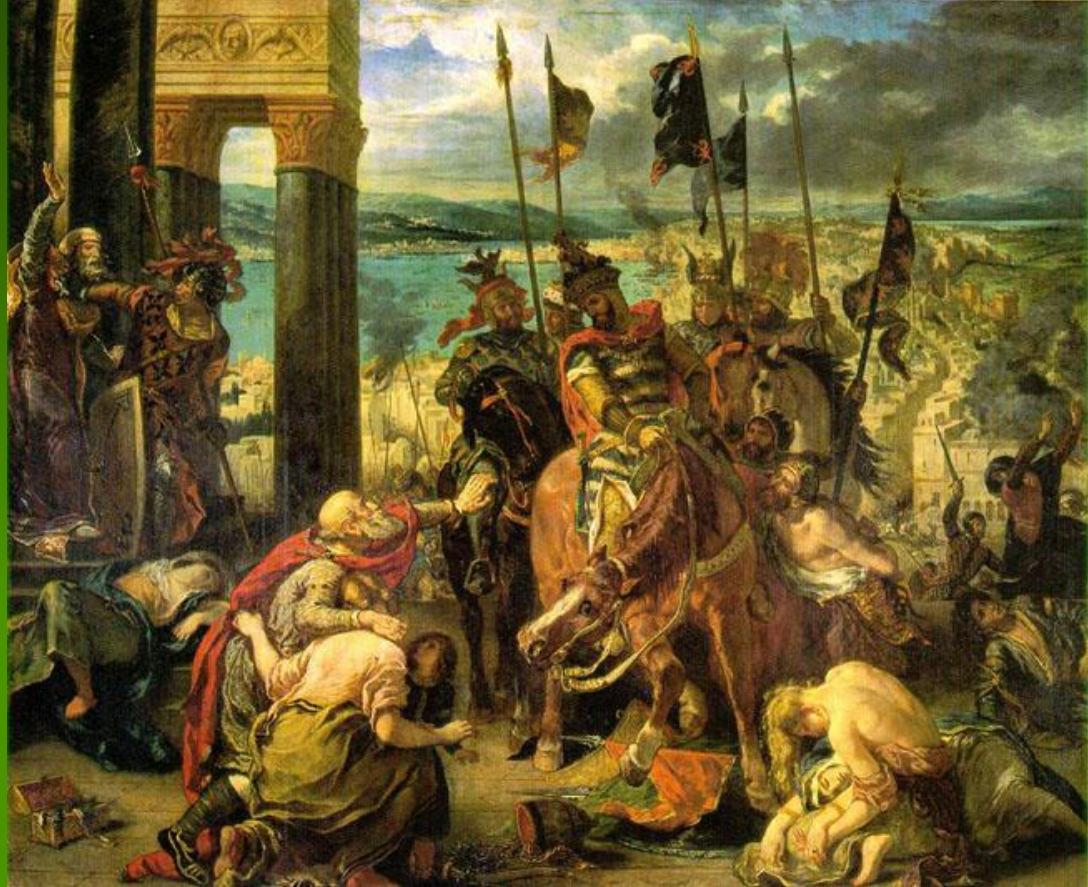
Эжен Делакруа "Вход крестоносцев в Константинополь". 1840 г.

Многогранное дарование Э.Делакруа проявилось в различных жанрах: исторической живописи ("Битва при Пуатье", "Битва при Нанси", 1831; "Битва при Тайбурге", 1837; "Взятие крестоносцами Константинополя", 1841 - все в Лувре, Париж; "Битва св.Георгия с драконом", ок.1854, Музей изящных искусств, Гренобль), монументальной декоративной росписи (потолок Тронного зала Палаты Депутатов, 1833-1837; библиотека Палаты Депутатов, 1838-1847; библиотека Люксембургского дворца, 1845; роспись "Оплакивание Христа" в церкви Сен-Дени дю Сен Сакреман, 1843), портрете (портреты Ф.Шопена, Ж.Санд, Н.Паганини, автопортрет 1832г.), натюрморте ("Большой охотничий натюрморт", 1826), пейзаже, в изображениях интерьеров и животных.