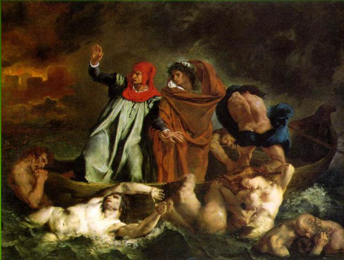
Эжен Делакруа "Ладья Данте". 1822 г.

Первая самостоятельная работа Э.Делакруа "Данте и Вергилий" ("Ладья Данте", 1822, Лувр, Париж), написанная на сюжет "Божественной комедии", принесла ему широкую известность и заставила заговорить о рождении нового художника-романтика. Мощное эмоциональное воздействие этого полотна в первую очередь объясняется нетрадиционным использованием цвета. В отличие от классицистов, отводящих ему второстепенное по сравнению с рисунком место, Э.Делакруа считает цвет важнейшим элементом живописи. Цветовое звучание "Данте и Вергилия" усиливается использованием контрастных тонов: яркие пятна красного и синего в изображении одежды и светлых оттенков обнаженных тел резко выделяются на зеленовато-синем и коричневом фоне.