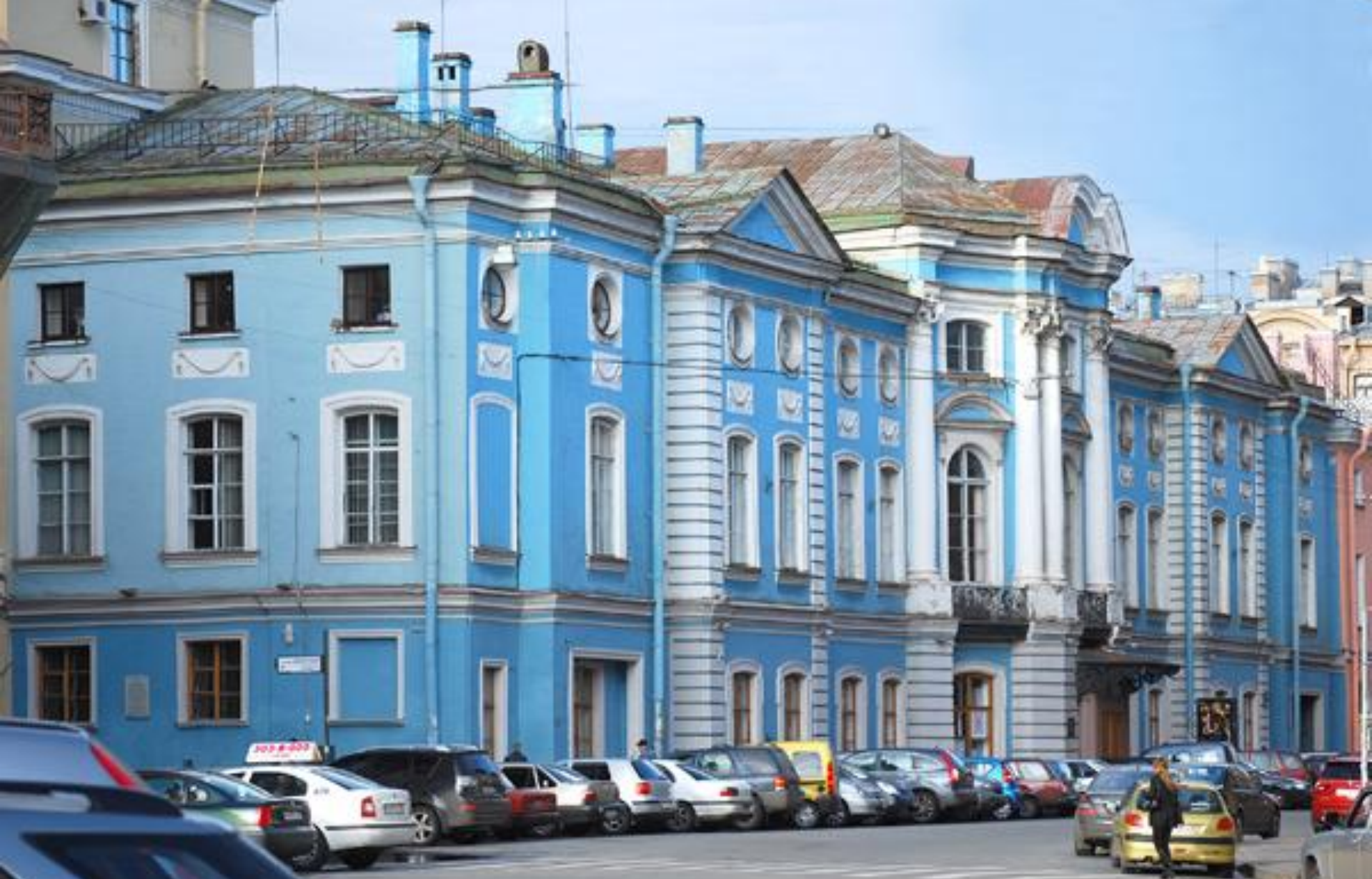
Дворец И. И. Шувалова

Архитекторы: Чевакинский С. И. Год постройки: 1753-1755 Стиль: Барокко