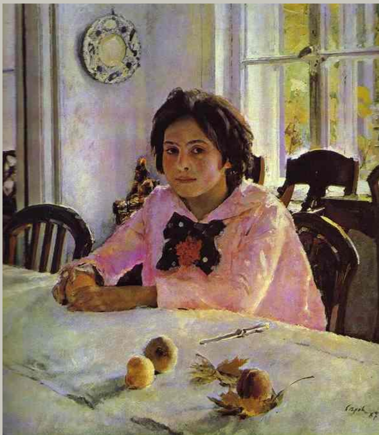
Девочка с персиками