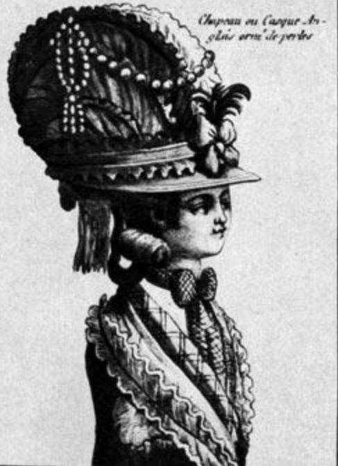
Chapeau ou Casque Anglois orné de perles