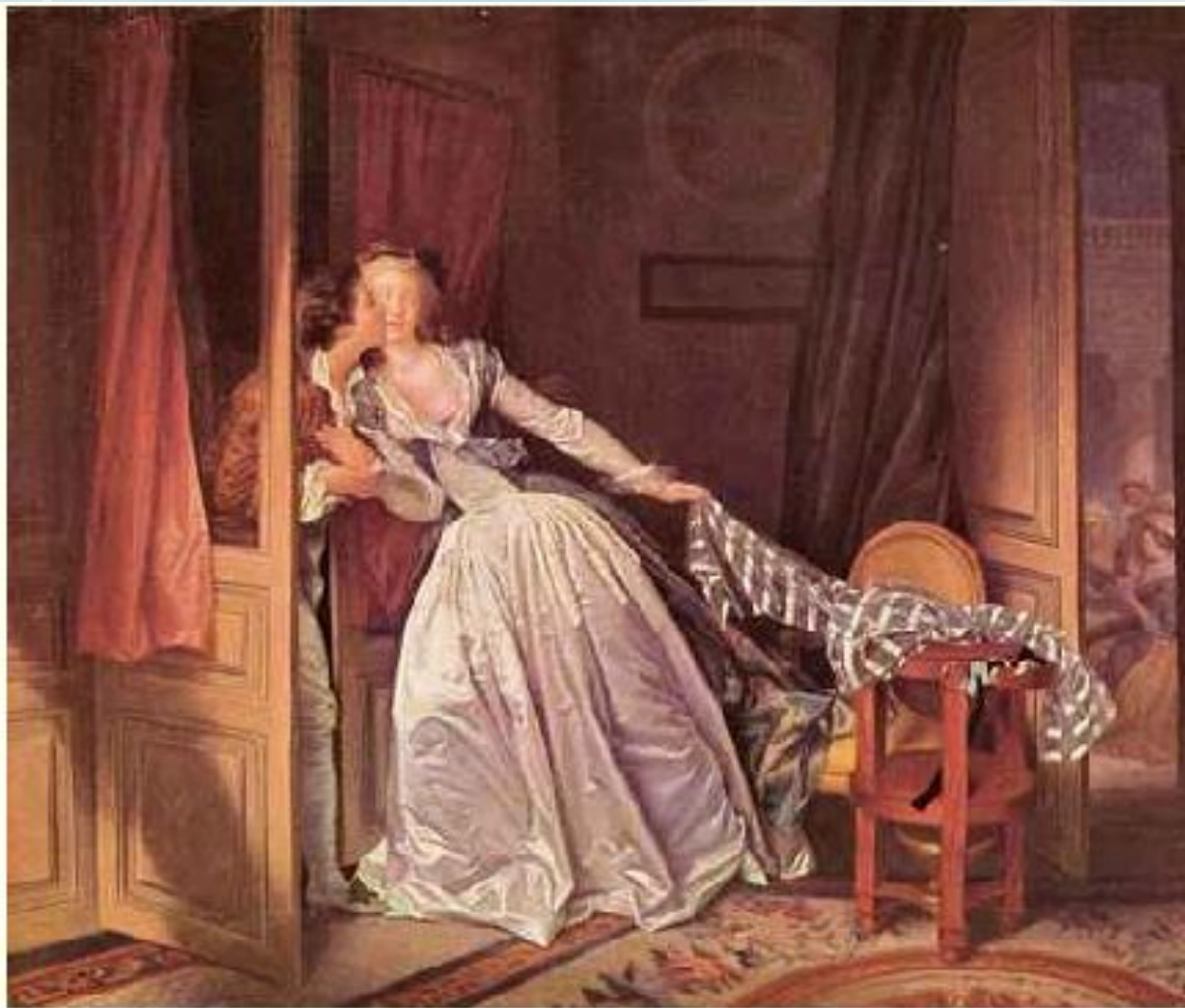
Фрагонар Жан-Оноре: Поцелуй украдкой