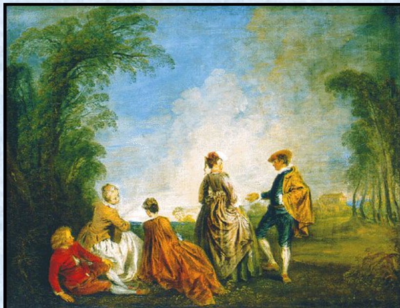
А.Ватто. "Затруднительное предложение". Ок. 1716. Государственный Эрмитаж, Санкт-Петербург.