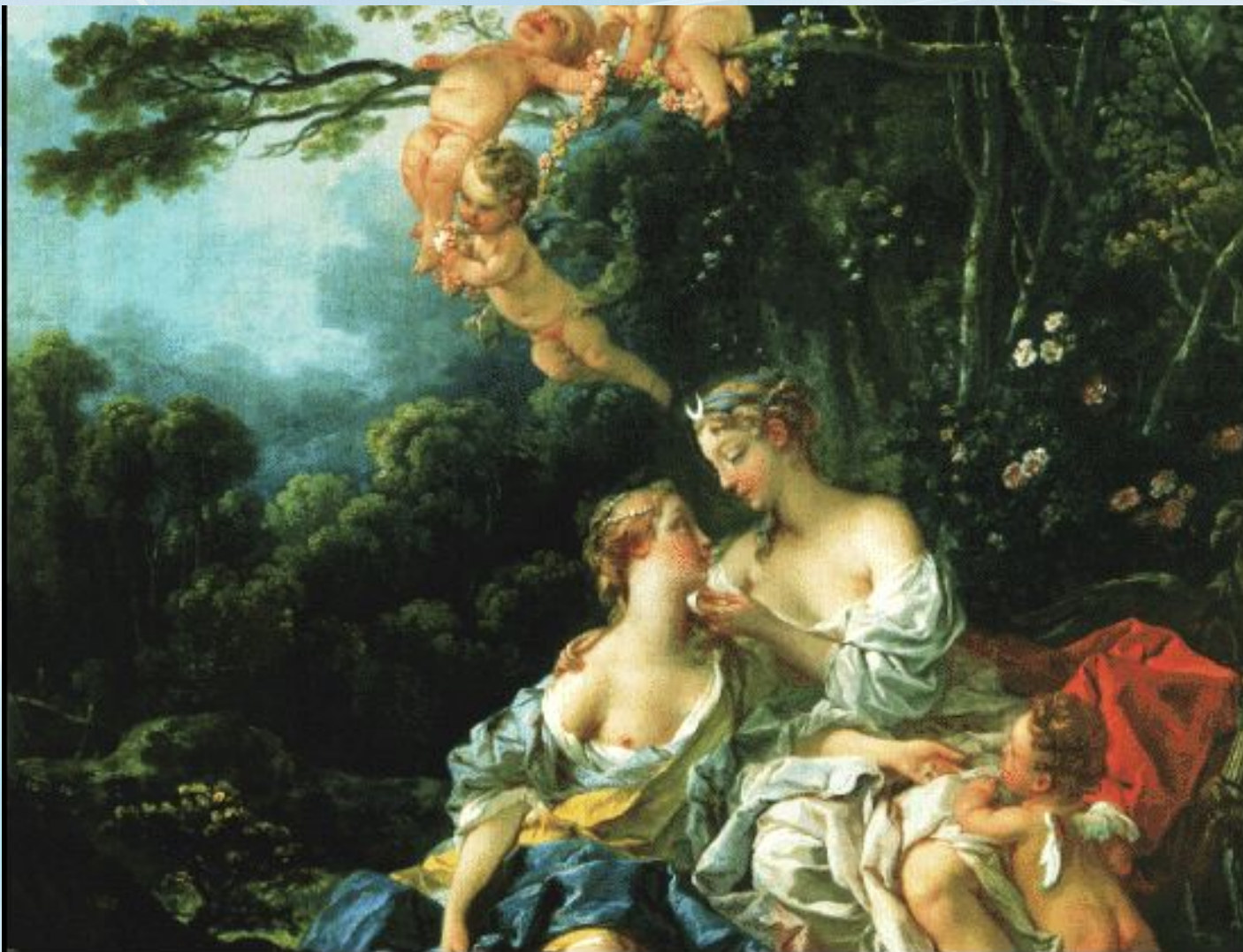
Ф.Буше. "Юпитер и Каллисто". 1744. Музей изобразительных искусств им. А.С.Пушкина. Москва.