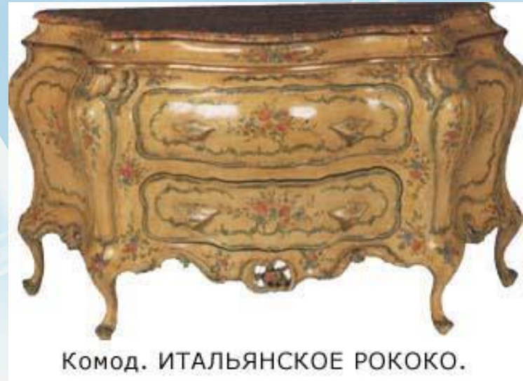
Комод. ИТАЛЬЯНСКОЕ РОКОКО.