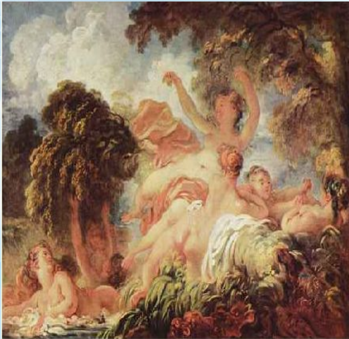
Фрагонар Жан-Оноре: Купальщицы