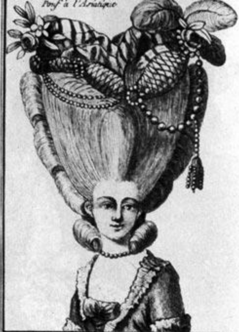
Touf à l'Arabique