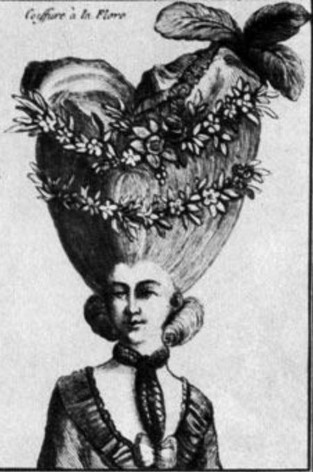
Coffure à la Flore