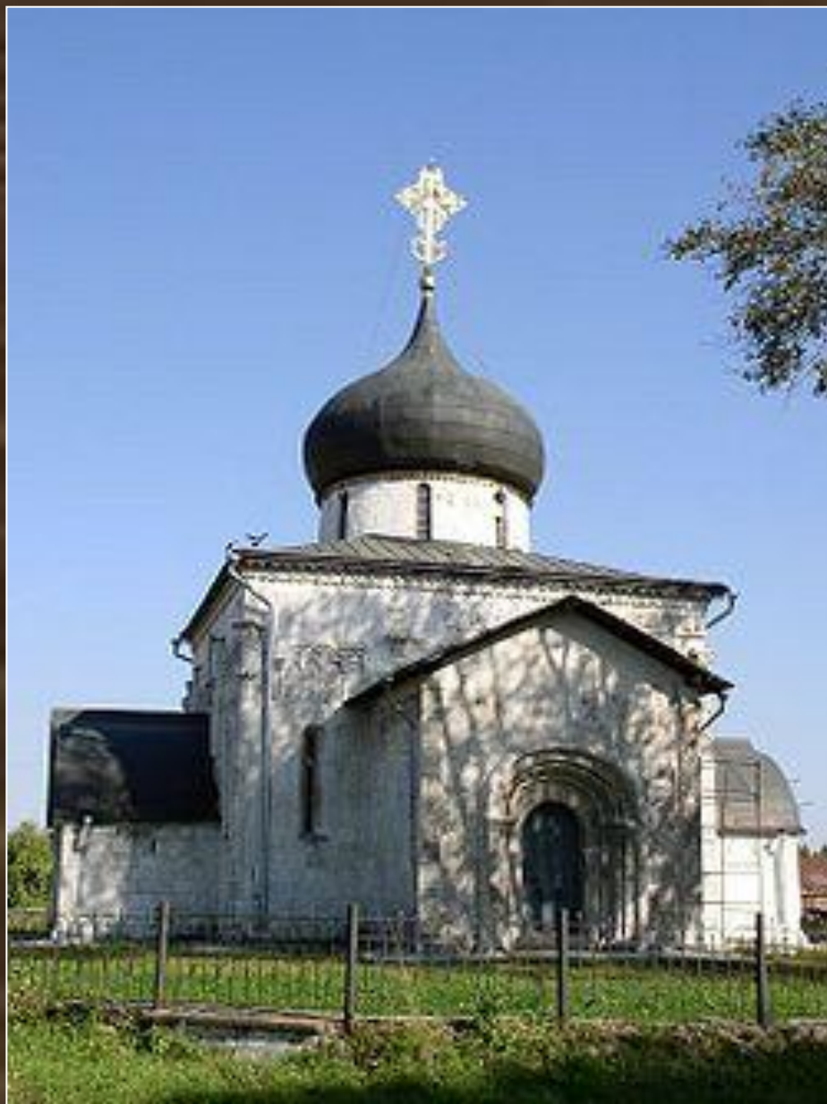
Георгиевский собор в Юрьеве-Польском. XIII в.