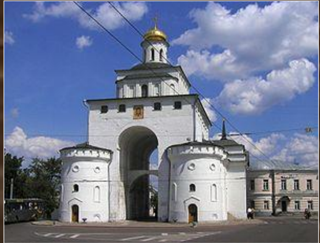
Успенский собор и Золотые ворота во Владимире. XII в.