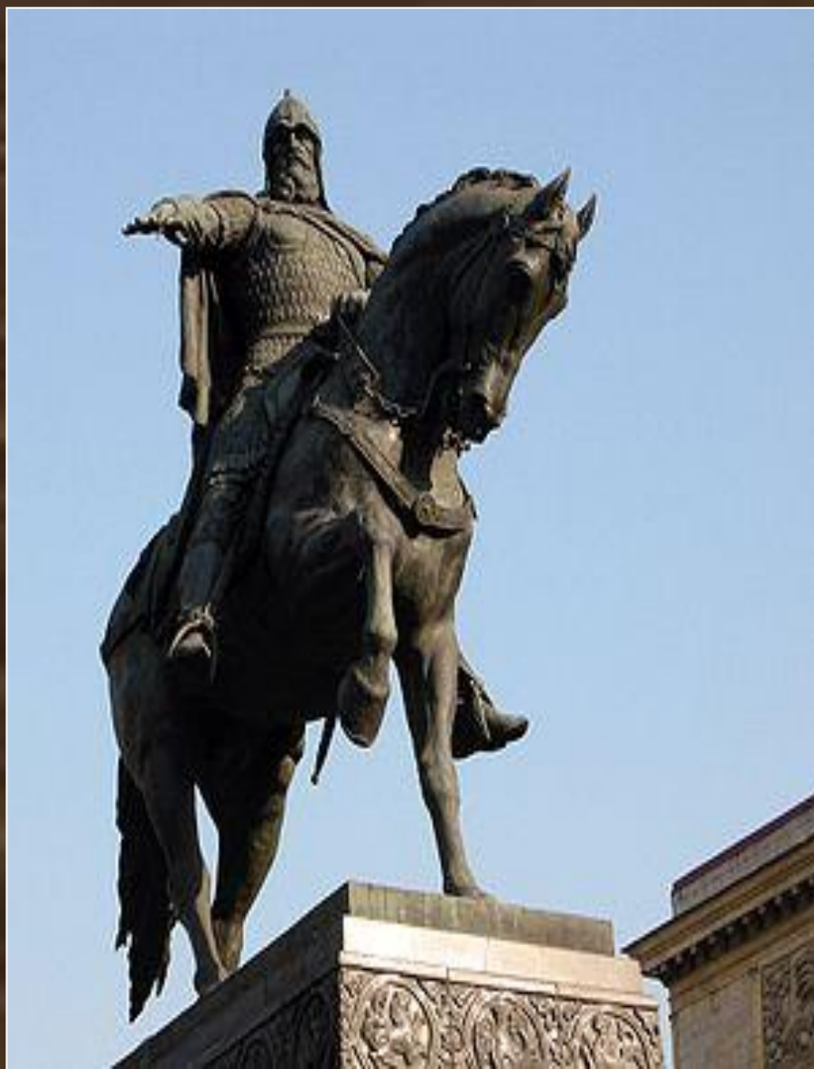
С. Орлов, А. Антропов, Н. Штамм. Памятник Юрию Долгорукому, 1954 г. бронза. Тверская площадь, Москва