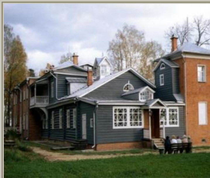
Музей-усадьба Мураново в Московской области