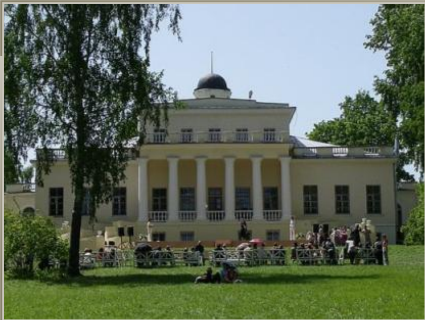
Музей-усадьба в Овстуге