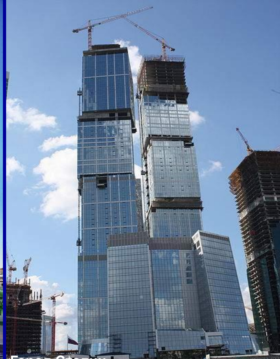
Город Столиц – состоит из двух башен 73-этажная Москва и 62-этажный Санкт-Петербург, высотой 294м и 255м