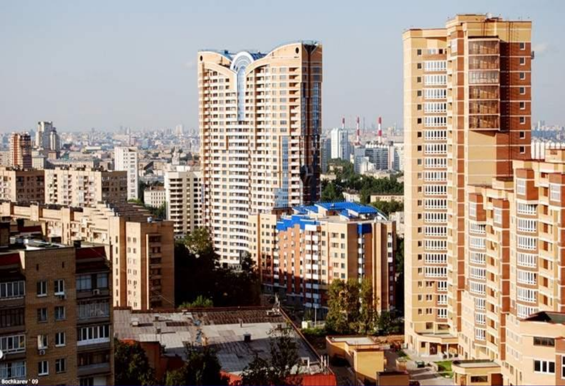
Жилые комплексы в Новых Черёмушках.