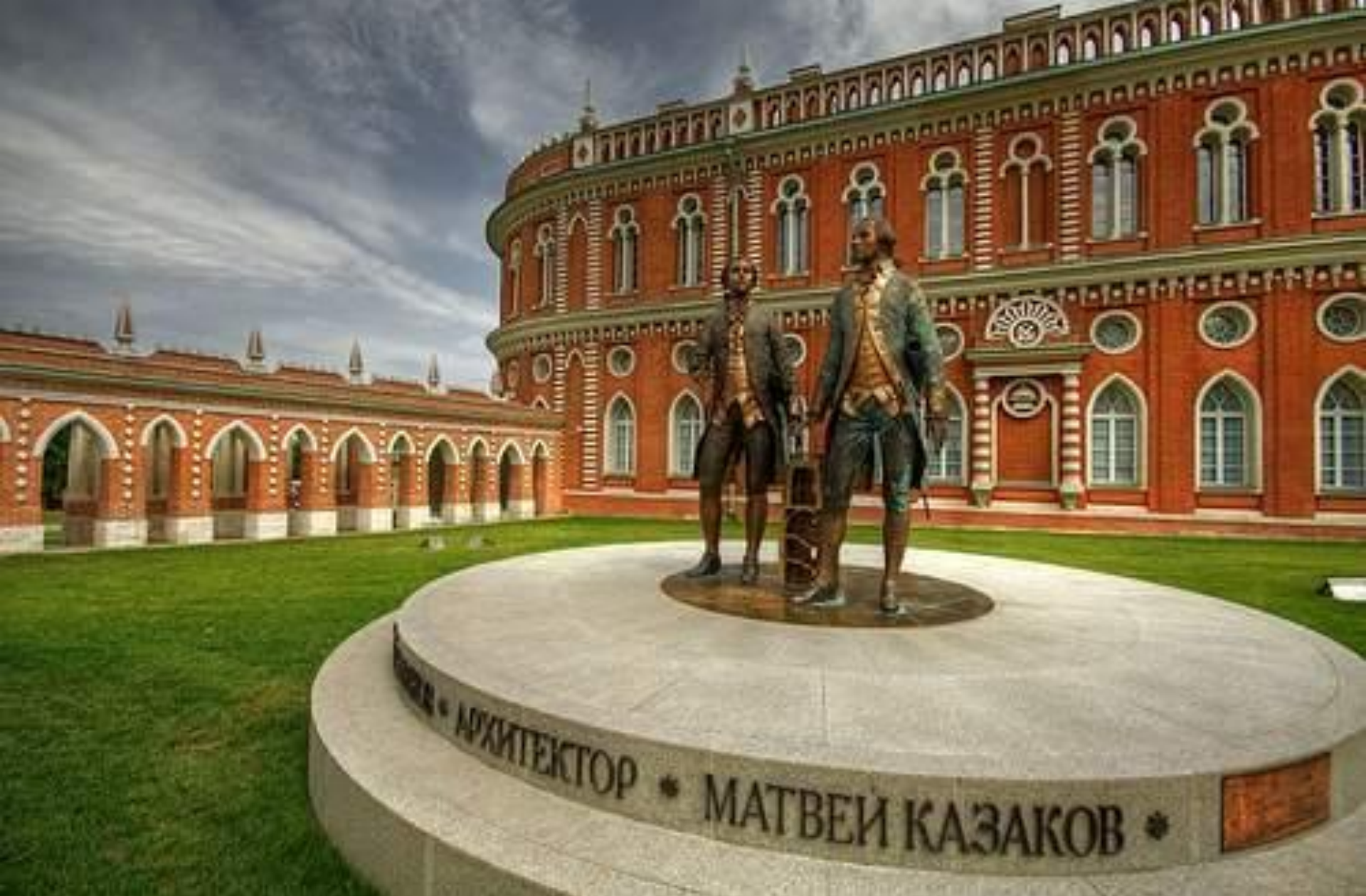
Памятник великим создателям архитектурно-паркового комплекса в Царицыно – В. Баженову и М. Казакову.