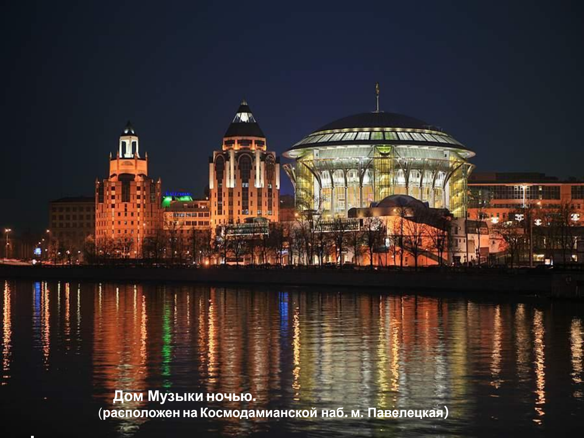
Дом Музыки ночью. (расположен на Космодамианской наб. м. Павелецкая)