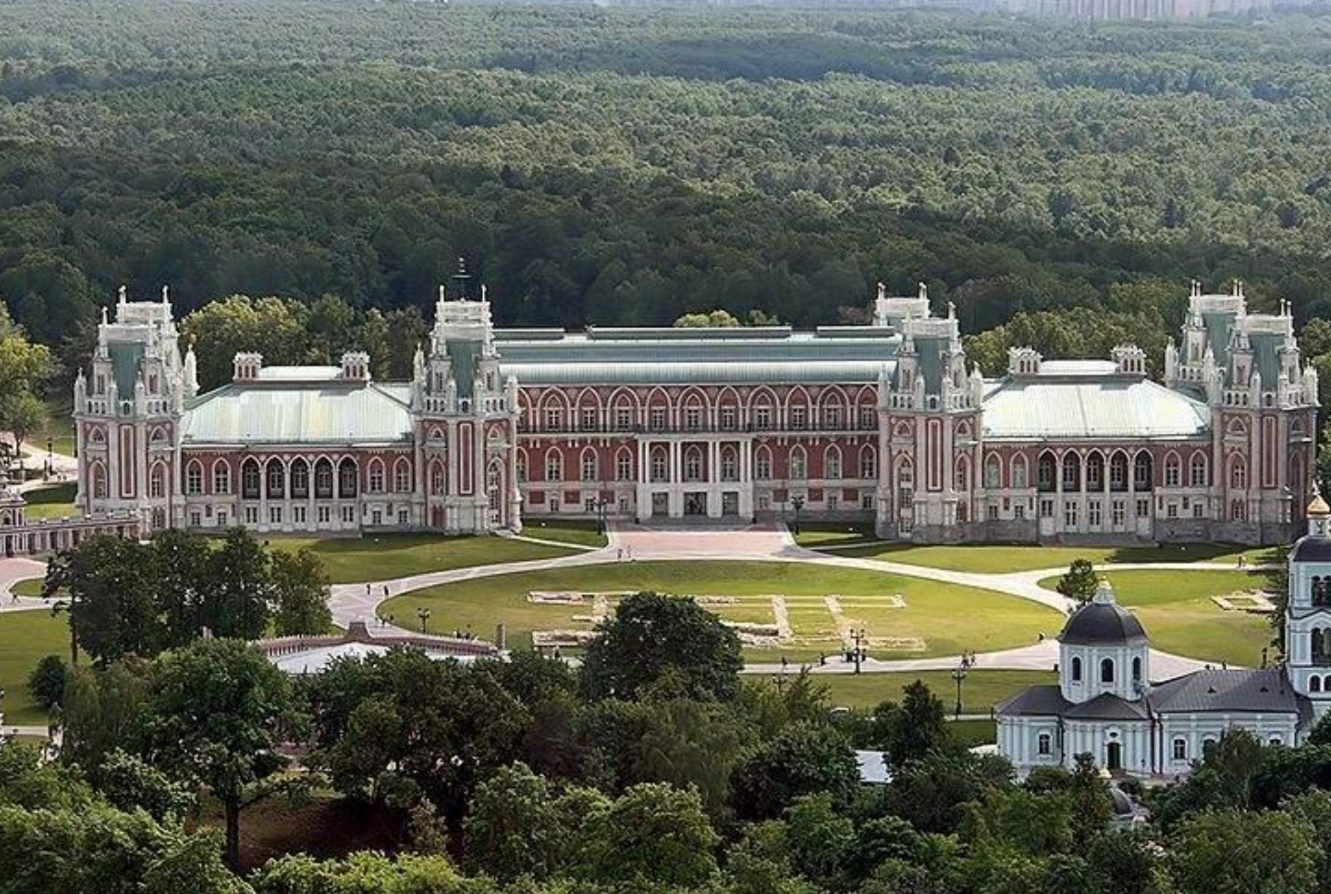
Воссозданный Большой дворец в архитектурно-парковом комплексе в Царицыно.