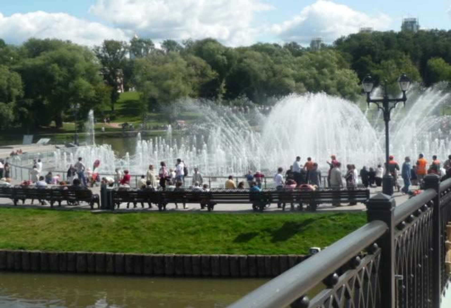
Грандиозный фонтан с подсветкой в Царицыно.