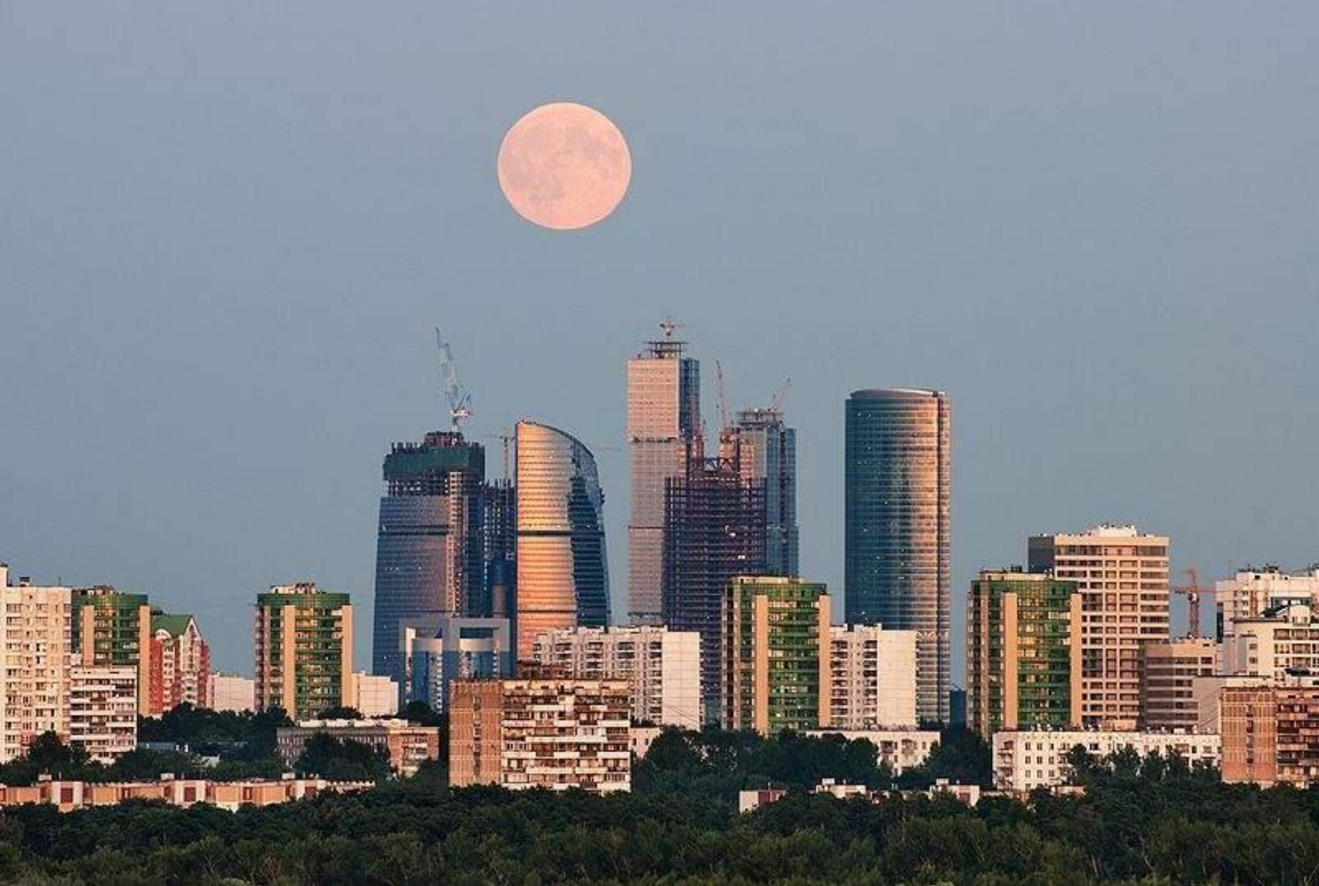
Московский международный деловой центр (ММДЦ) Москва-Сити, строящийся в Пресненском районе. (Фото -5 августа 2009).