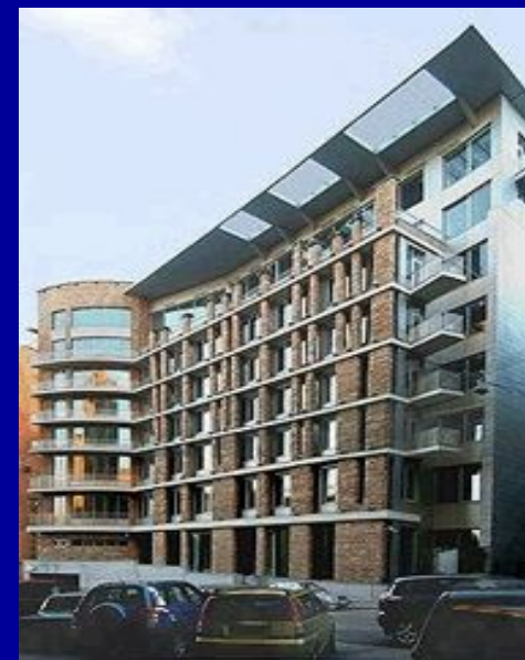
Лучшие здания современной Москвы по мнению ведущих архитектурных критиков