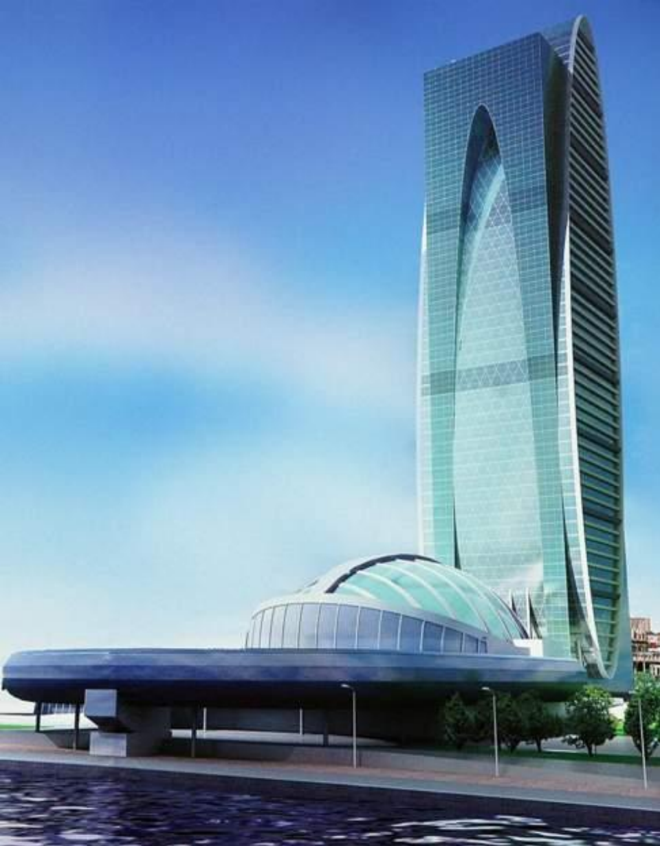
Офисные помещения, апартаменты, гостиница и развлекательный центр. Ввод 2010