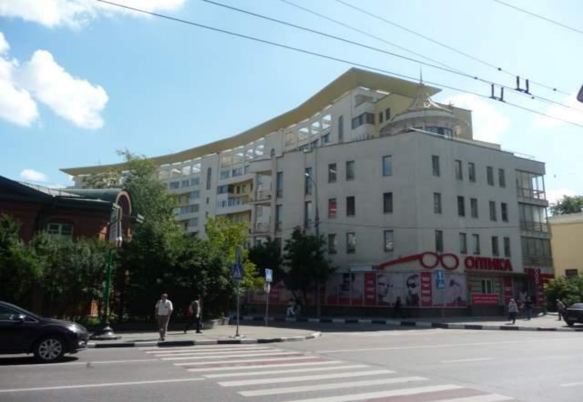
Два жилых дома у станции метро Серпуховская (см. след. слайд).