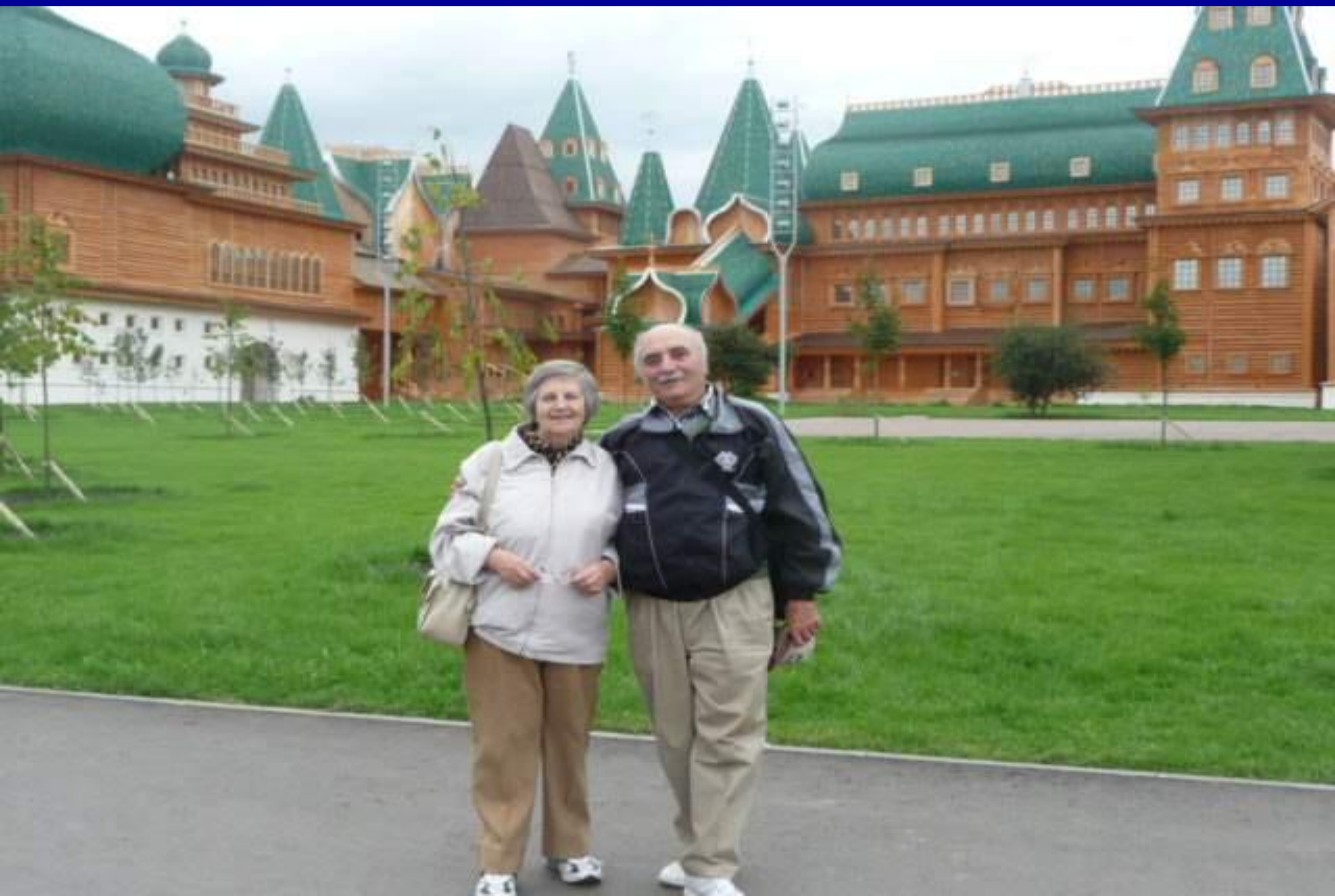
Воссозданный дворец царя Алексея Михайловича в Коломенском.