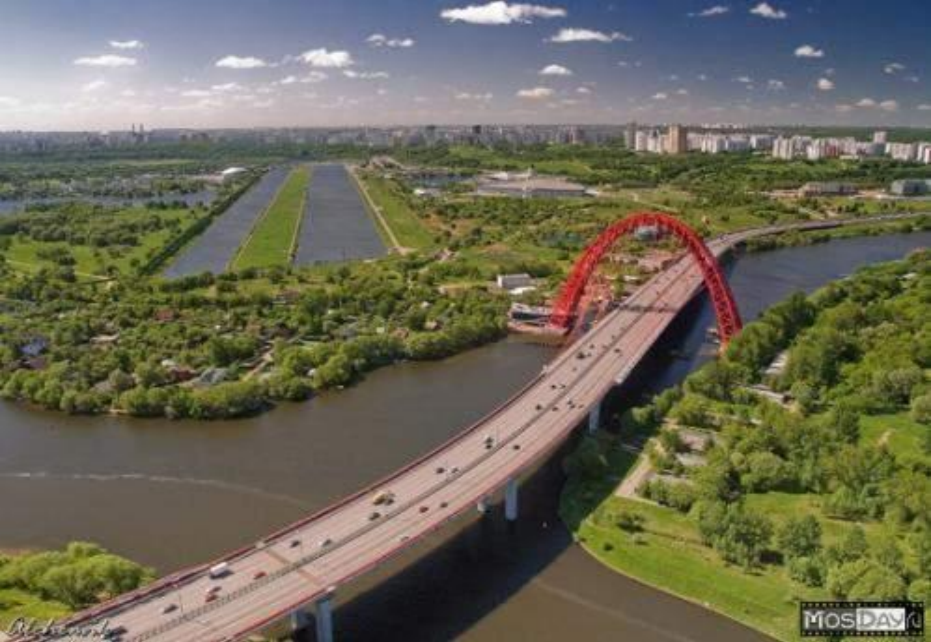
Хорошево-Мневники, “Живописный мост”.