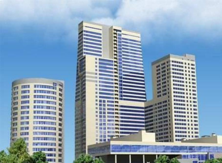
Покровское-Стрешнево -жилой комплекс