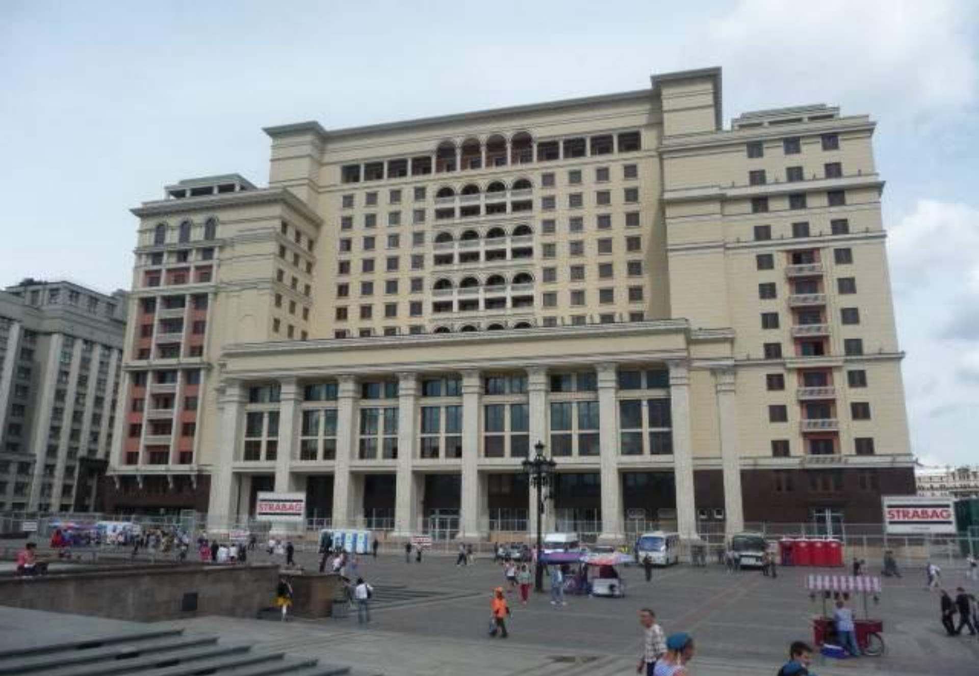
Новое здание гостиницы “Москва”, 2009. Манежная площадь.