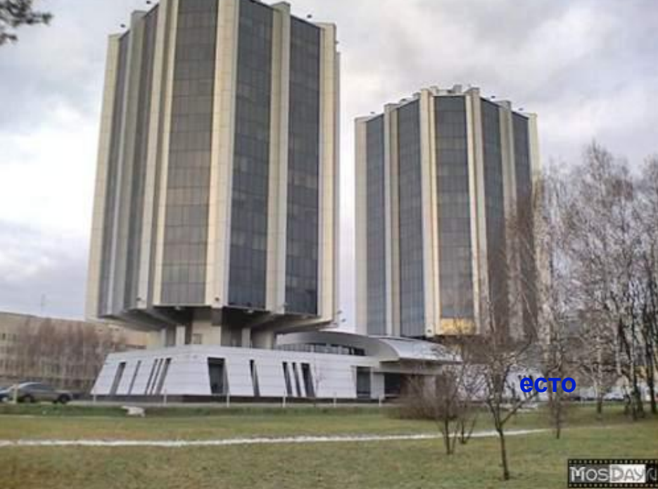
Раменки и Новые дома-башни.