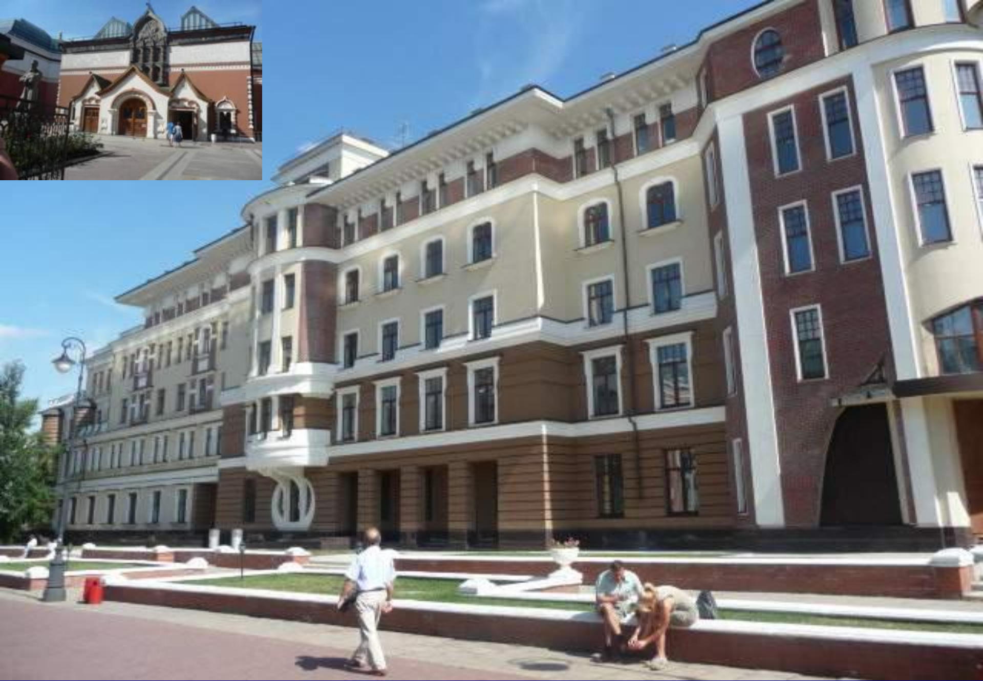
Жилой дома рядом с Третьяковской галереей.