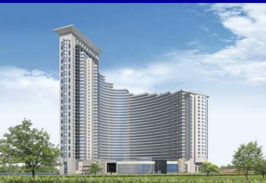
Жилой комплекс" ДОМ В СОКОЛЬНИКАХ".