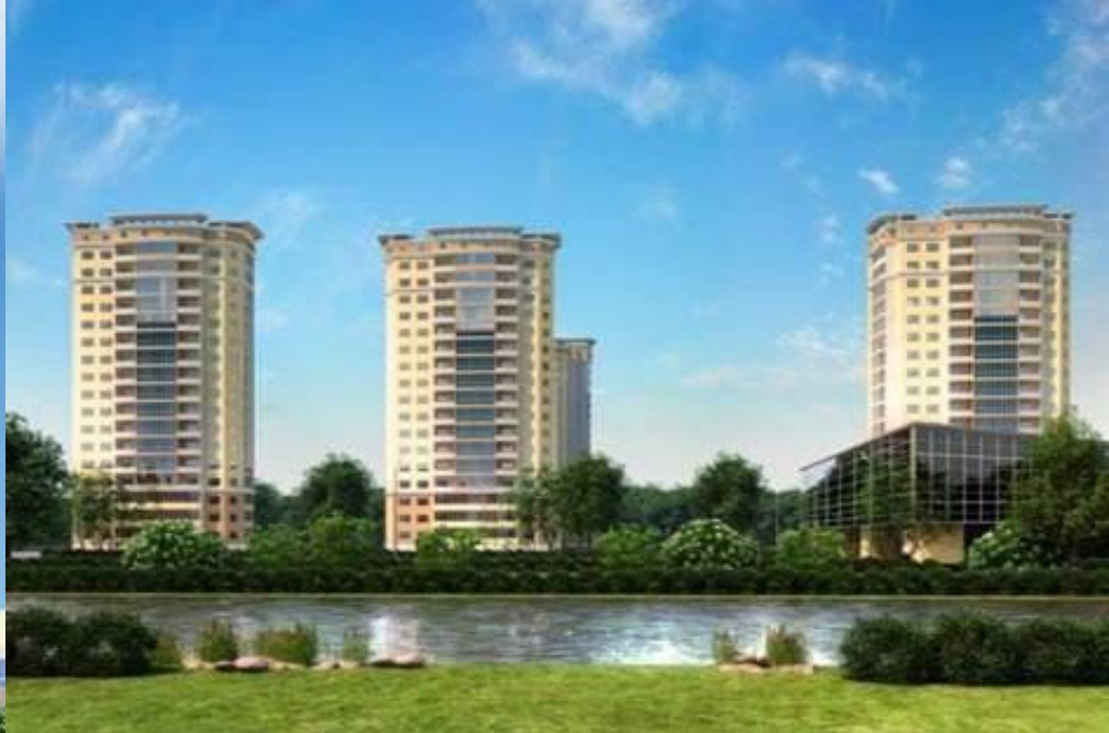
Орехово-Зуево- жилой комплекс "Breeze."