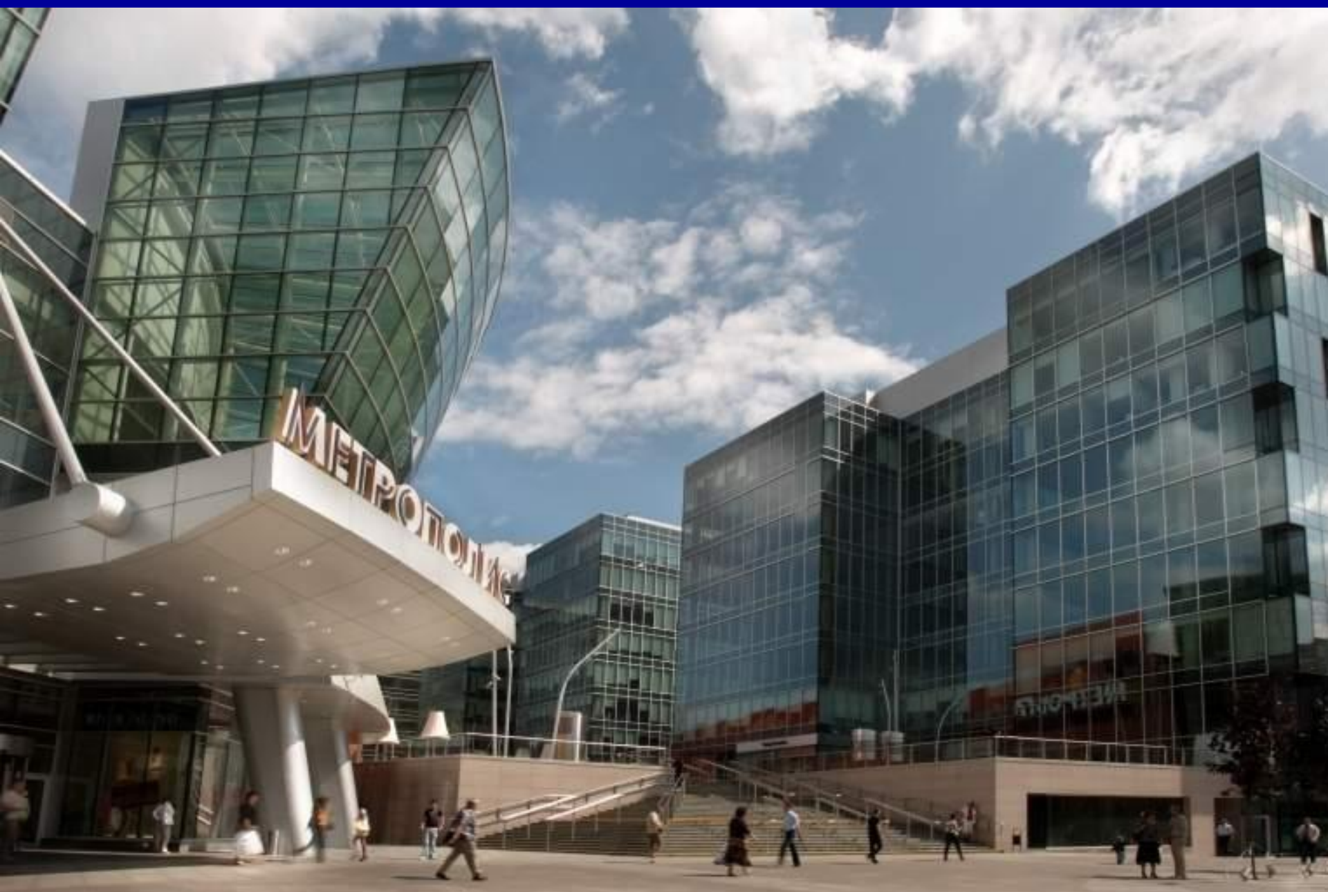
Метро Войковская. Бизнес центр “Метрополис”.