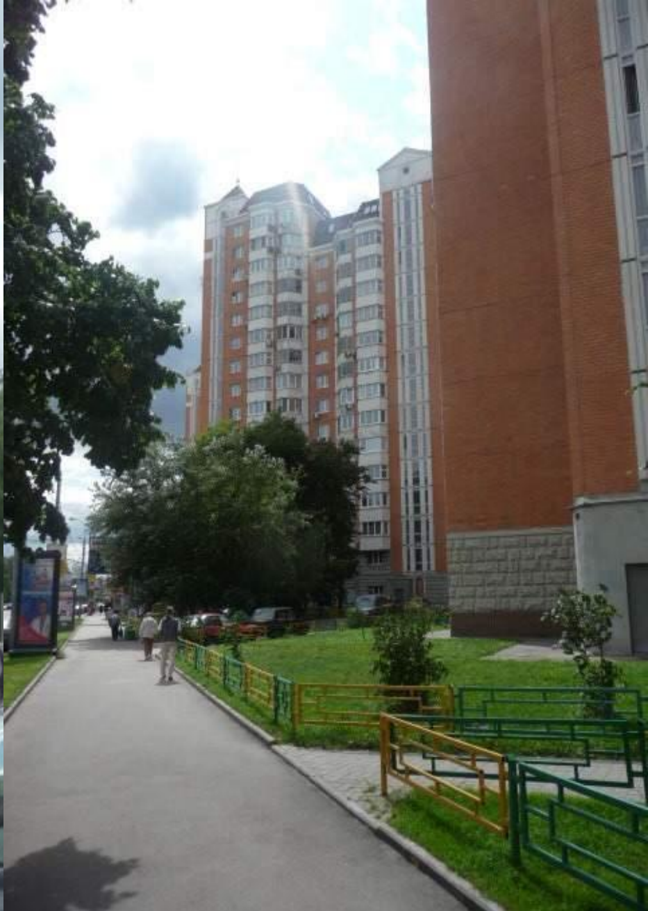
Жилые дома у станции метро “1905 год”