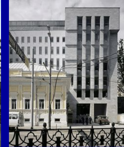
Лучшие здания современной Москвы по мнению ведущих архитектурных критиков