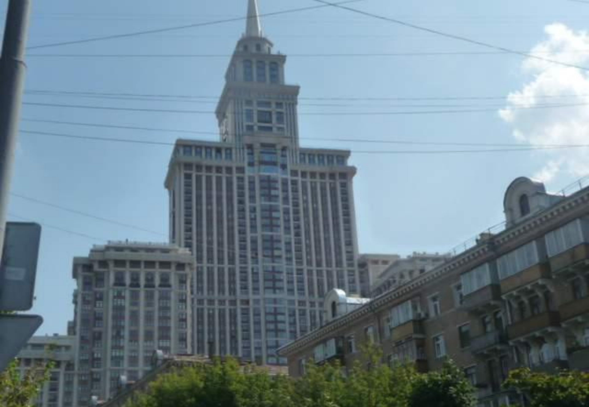
Сокол. Жилой комплекс - "Триумф - Палас."