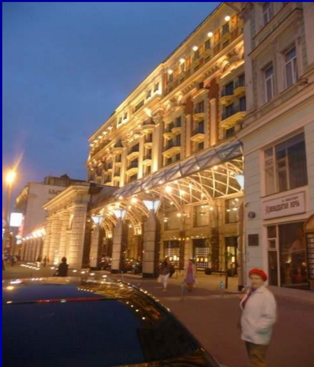
Гостиница “Ritz-Carlton”, построена на месте гостиницы “Интурист.”