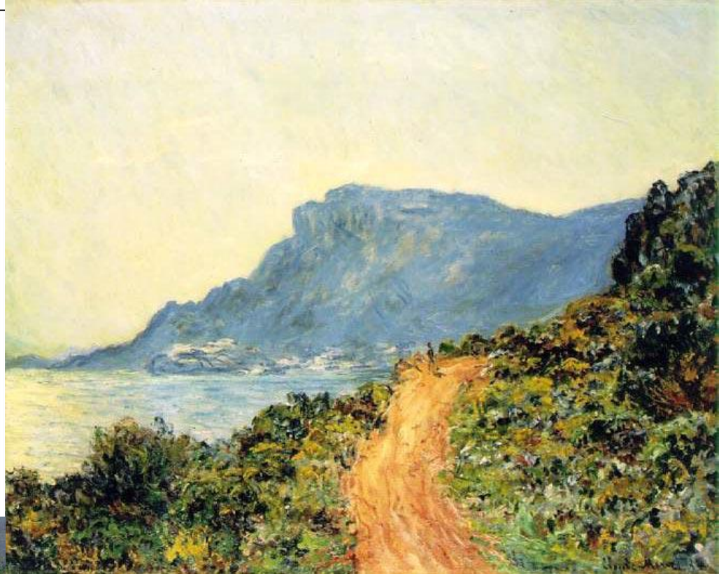
Рис.8 Моне К. «Пейзаж в Монако»

Импрессионисты предложили новое видение мира и новые принципы живописи. Они воспринимали окружающую действительность как бесконечную смену впечатлений. Картина становится как бы отдельным кадром, фрагментом подвижного мира. Появилась свежесть и непосредственность в изображении повседневной жизни современного города, его пейзажей, вида, быта и развлечений его жителей.