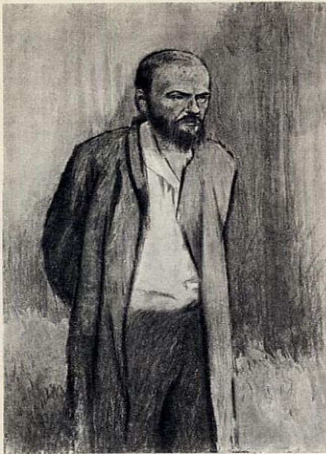
Ф. М. ДОСТОЕВСКИЙ НА КАТОРГЕ. Худ. В. Домогацкий. 1956 г.