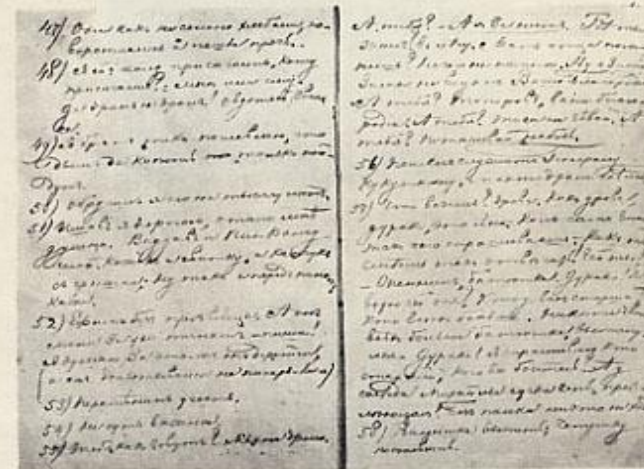
СИБИРСКАЯ ЗАПИСНАЯ КНИЖКА. Автограф Ф. М. Достоевского.

Ф. М. Достоевский — М. М. Достоевскому. 22 февраля 1854 г.