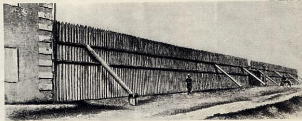
ОГРАДА ВОКРУГ ОМСКОГО ОСТРОГА. Гравюра по фотографии. 1897 г.