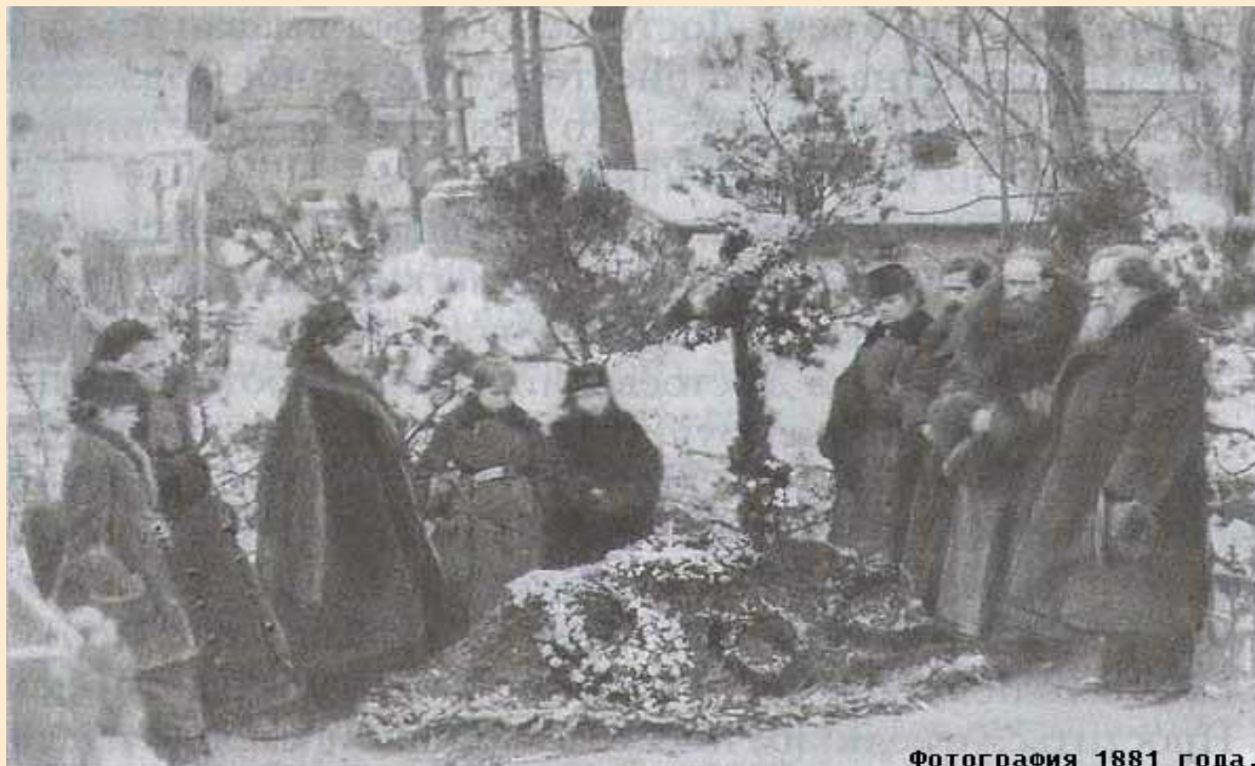
Фотография 1881 года.

31 января 1881 при огромном стечении народа состоялись похороны писателя. Он похоронен в Александро-Невской лавре в Петербурге.